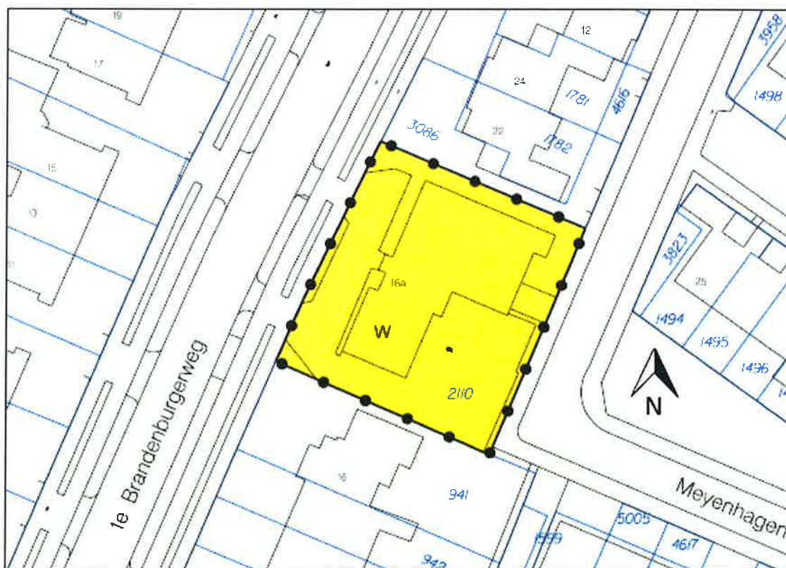
Figuur 1: Uitsnede plankaart