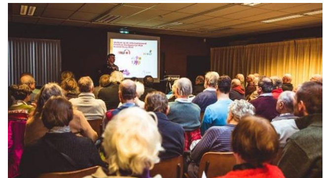
N.B. foto van informatiebijeenkomst van de vorige aanvraag (voor corona)