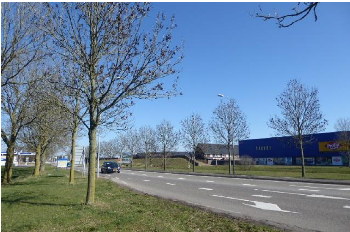
Foto 1, De onderzochte en beoordeelde essen langs de Europaweg.

GEMEENTE DOETINCHEM BELEID / PROJECTBUREAU