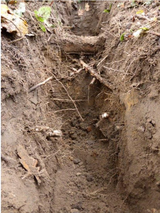
Foto 6 , Proefsleuf es 19230