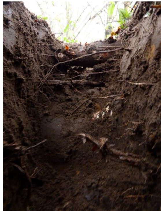
Foto 7 , Sleuf es 20146