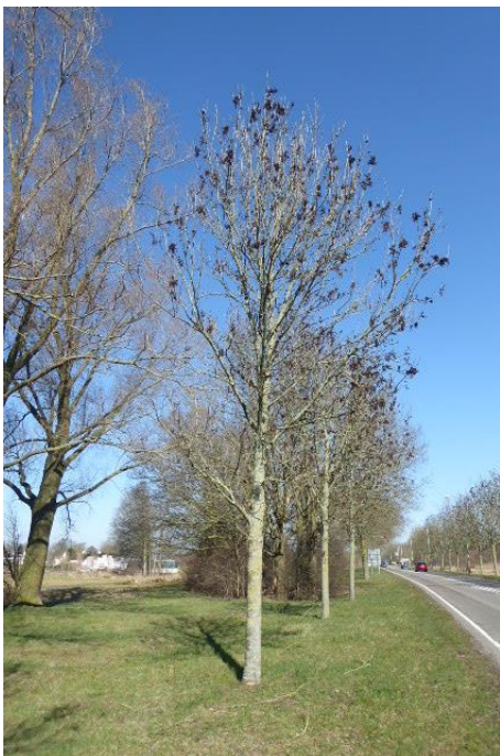
Foto 2, Wilgen links vallen buiten het gebied, de essen erbinnen

De onderzoeksvraag, die aan ANDE(R)S Boomtechnisch Advies is voorgelegd, luidt: “Onderzoek de bomen in de nabijheid van het plangebied. Op welke manier is een duurzaam behoud te realiseren”