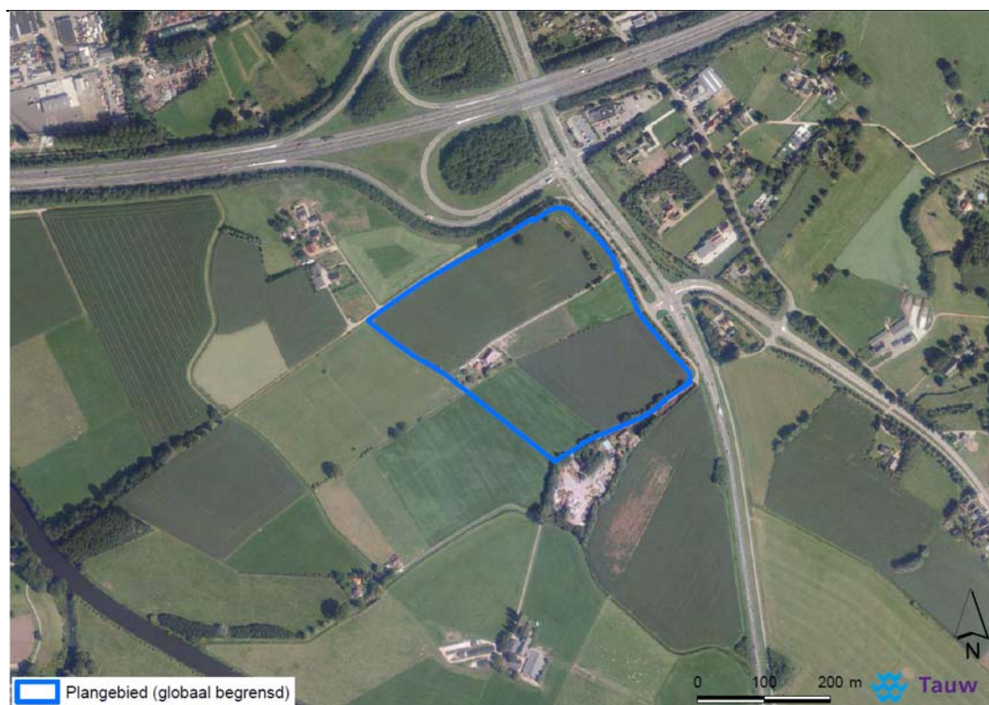
Figuur 1.1 Ligging plangebied (globaal begrensd door de blauwe contour)

Langs de N317 staan enkele (jonge) bomenrijen (net binnen en op de grens van het plangebied). In het midden van het plangebied staat een woonboerderij met twee (oude) schuren. In figuur 1.2 is een impressie van het plangebied opgenomen.