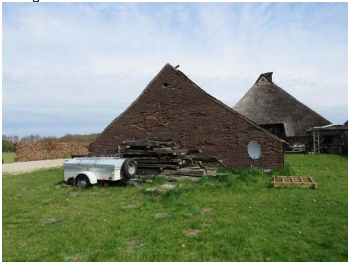
Oude schuur nabij boerderij