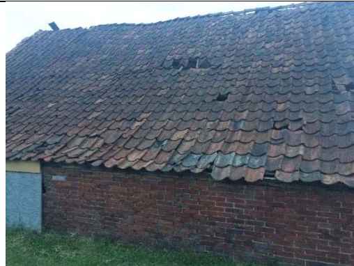
Oude schuur nabij boerderij