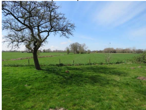
Monotone graslanden in plangebied