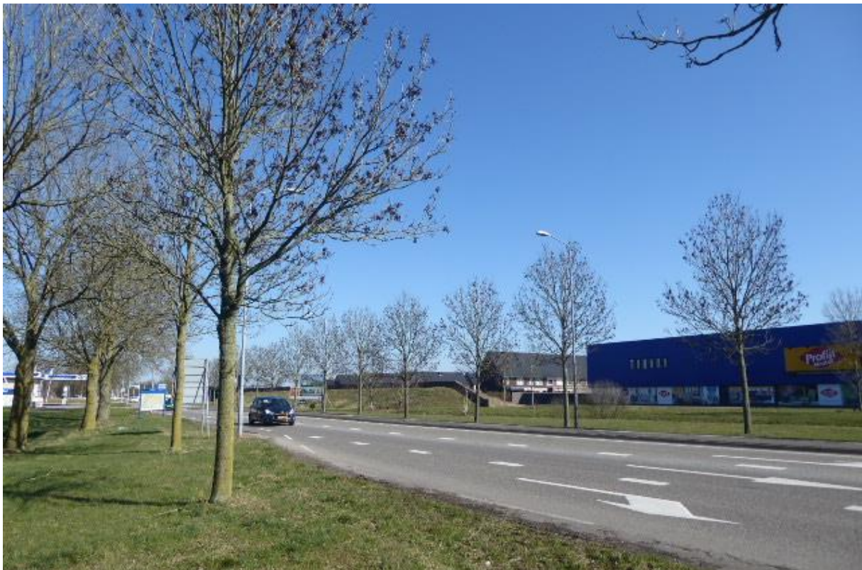
Foto 1, De onderzochte en beoordeelde essen langs de Europaweg.

GEMEENTE DOETINCHEM BELEID / PROJECTBUREAU