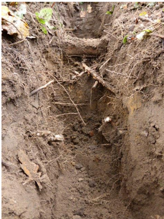
Foto 6 , Proefsleuf es 19230