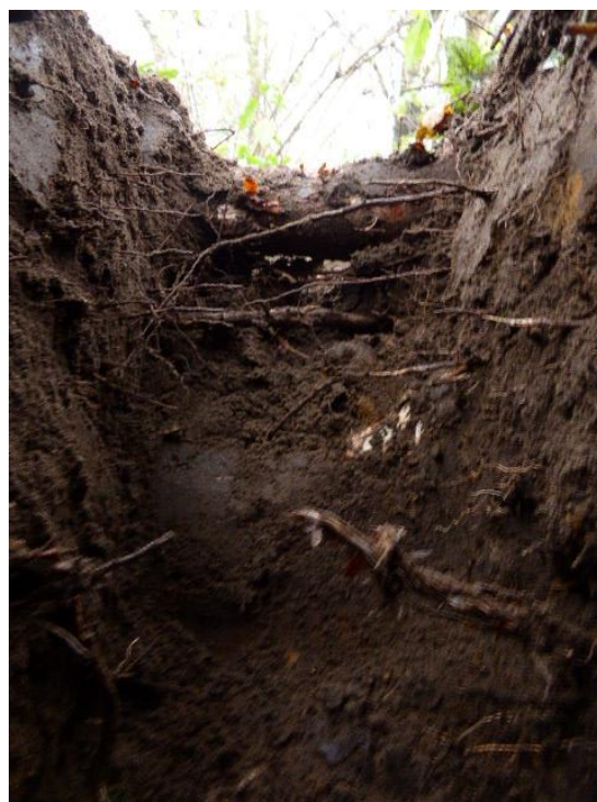
Foto 7 , Sleuf es 20146