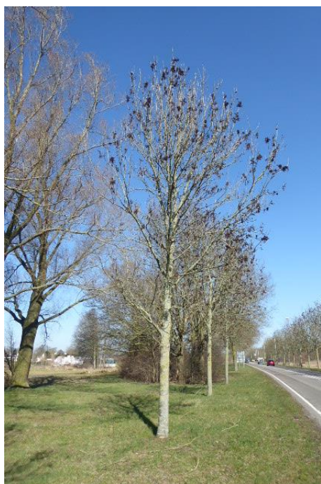
Foto 2, Wilgen links vallen buiten het gebied, de essen erbinnen

De onderzoeksvraag, die aan ANDE(R)S Boomtechnisch Advies is voorgelegd, luidt: “Onderzoek de bomen in de nabijheid van het plangebied. Op welke manier is een duurzaam behoud te realiseren”