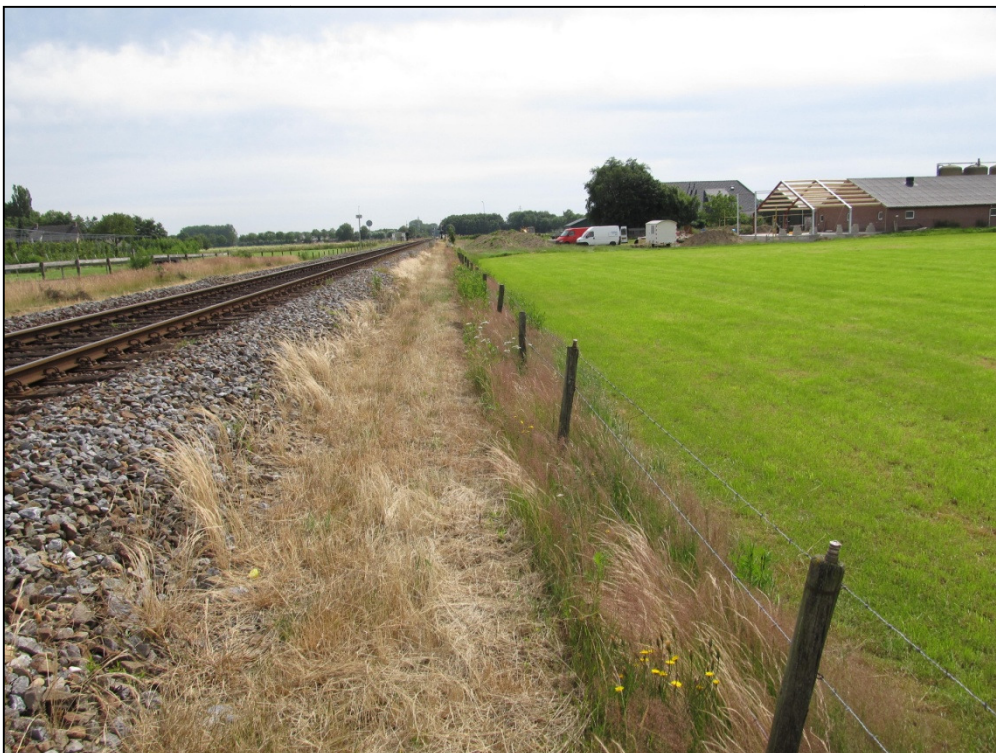
Figuur 3. Gemaaide spoorberm.

Tijdens de eerste veldronde zijn geen beschermde planten aangetroffen. Bij het tweede veldbezoek bleek een deel van de vegetatie gemaaid te zijn, wat de inventarisatie enigszins bemoeilijkt heeft. Op figuur 3 is de gemaaide strook te zien.