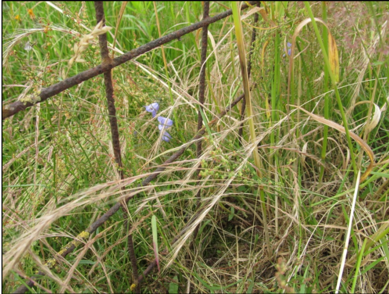
Figuur 4. Grasklokjes in de berm.

Grasklokje is een tabel 1 soort van de Flora- en faunawet. Voor deze soort geldt een algehele vrijstelling voor het overtreden van enkele verbodsbepalingen wanneer sprake is van bestendig beheer en onderhoud en bestendig gebruik of van werkzaamheden in het kader van ruimtelijke inrichting of ontwikkeling.