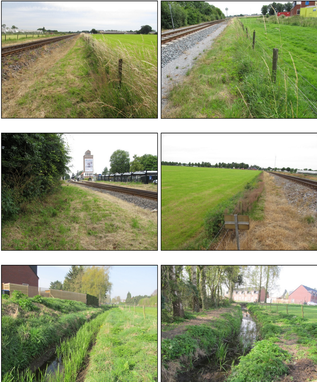
Figuur 2. Impressie van het plangebied