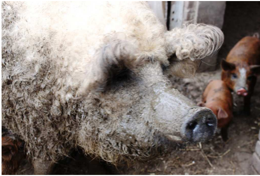
Links: Mangalitzza fokzeug