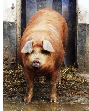
Rechts: Duroc vleesvarken