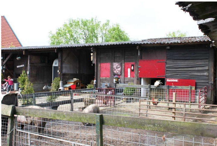
Nummer 5 Opstal: vleesvarkens en afgespeende biggenverblijven. Overzichtsfoto