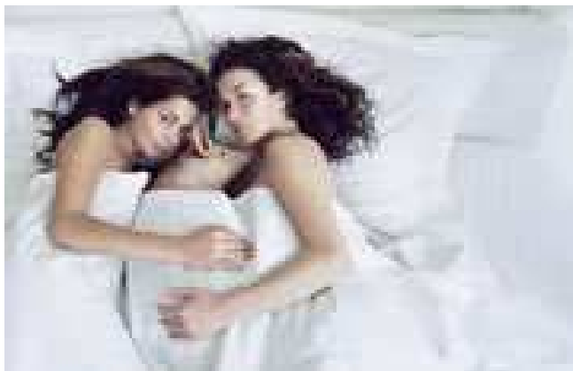
Big van Frank en Frij poseert met Katja Schuurman en Georgina Verbaan in groot bed voor campagne in Amsterdam: 'Eet geen dierenleed.'

In oktober 2012 krijg ik een groep Belgische consumenten en koks op bedrijfsbezoek. Zij willen met eigen ogen zien, waar dat goede vlees vandaan komt. Ook zij zijn welkom.