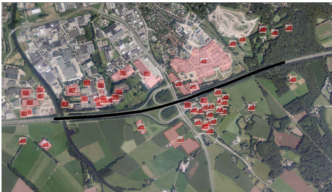
Figuur 4.1 Populatiepolygonen binnen invloedsgebied van de weg

In figuur 4.1 zijn de populatiepolygonen nabij de weg en het plangebied weergegeven.