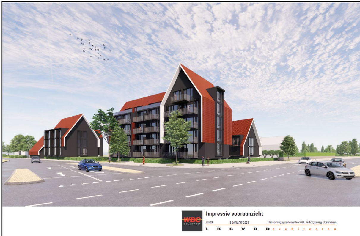
Afbeelding 2 3D-impressie gewenste situatie (bron: LKSVDD Architecten)

De voorgenomen ontwikkeling is niet in overeenstemming met het ter plaatse geldende omgevingsplan. Om het voornemen mogelijk te maken is een wijziging van het omgevingsplan benodigd. Onderdeel daarvan is dat aangetoond moet worden dat wordt voldaan aan de Ladder voor duurzame verstedelijking. Voorliggende ladderonderbouwing voorziet in de benodigde toetsing in het kader van de Ladder voor duurzame verstedelijking.