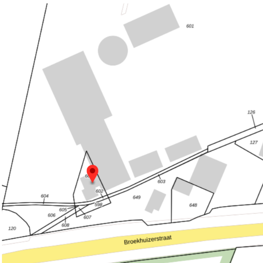
Figuur 3 kadastrale situatie Gemeente Wehl

De kadastrale ligging van het projectgebied is gemeente Wehl, gelegen op de perceel nummers 600, 601, 602, 603, 648, 649, 126