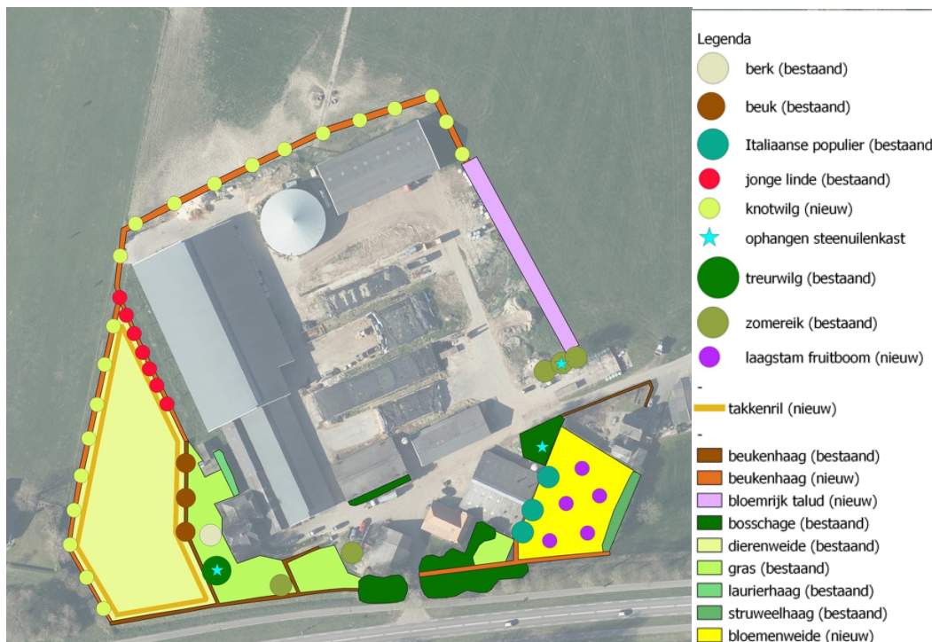
Figuur 7 Landschappelijke inpassing (Staring advies)

Voor het project is een landschappelijke inpassing opgesteld in samenwerking met Staring Advies. Deze is ook getoetst aan de provinciale instructieregel Landschap waarbij uit wordt gegaan van de kernkwaliteiten van de Gelderse streek Liemers.