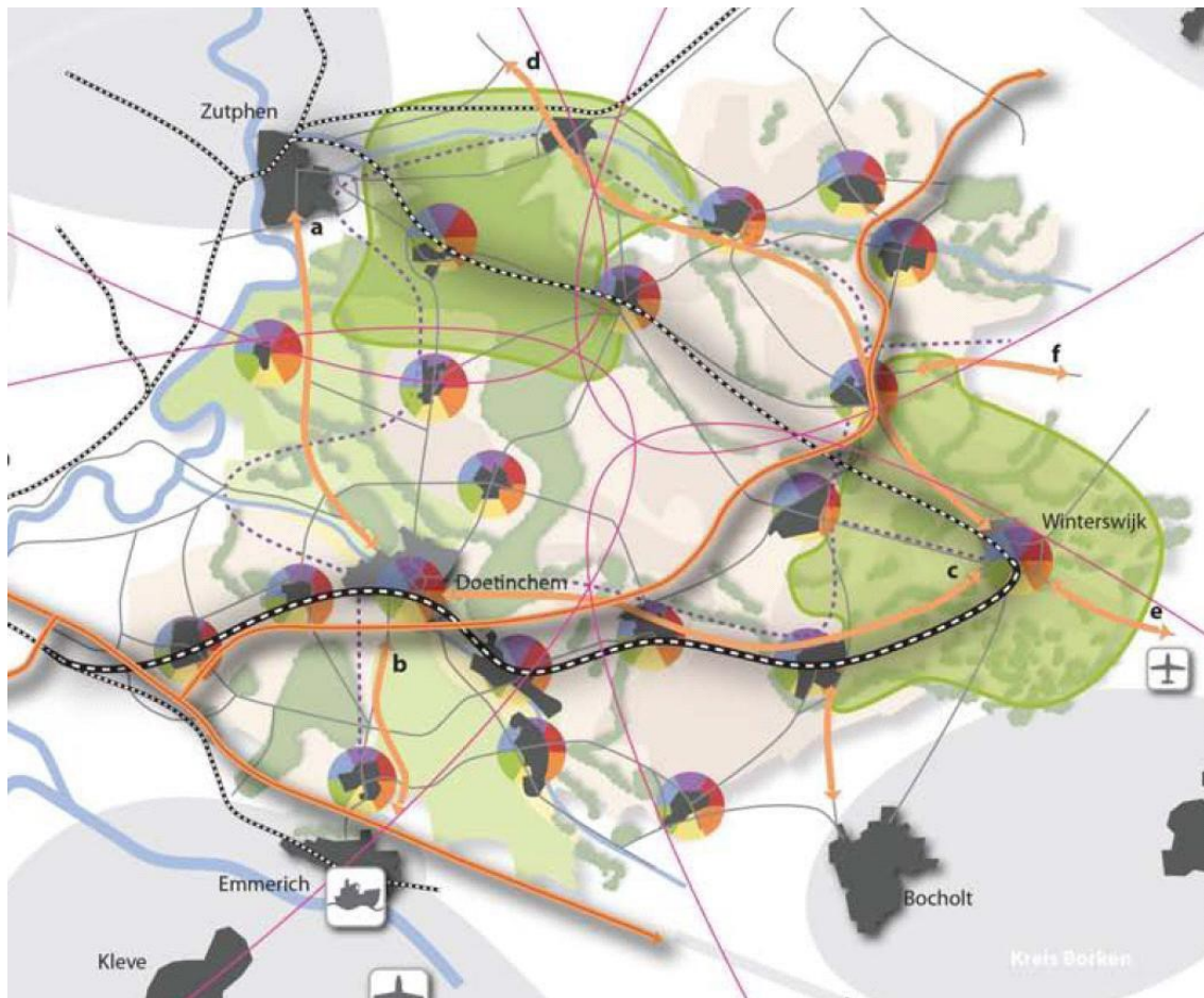
Figuur 6 Visiekaart Achterhoek