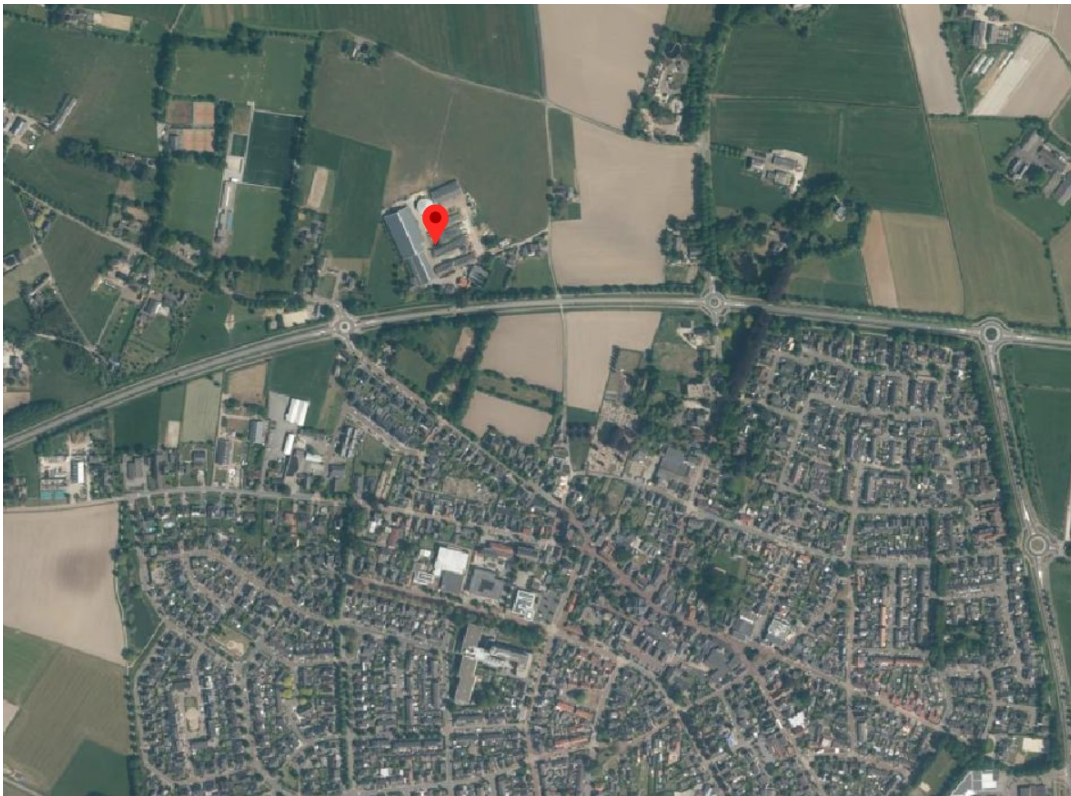
Figuur 2 Luchtfoto situering projectgebied

Het projectgebied bevindt zich in het buitengebied van de gemeente Doetinchem, ten noorden van de bebouwde kom van Wehl.