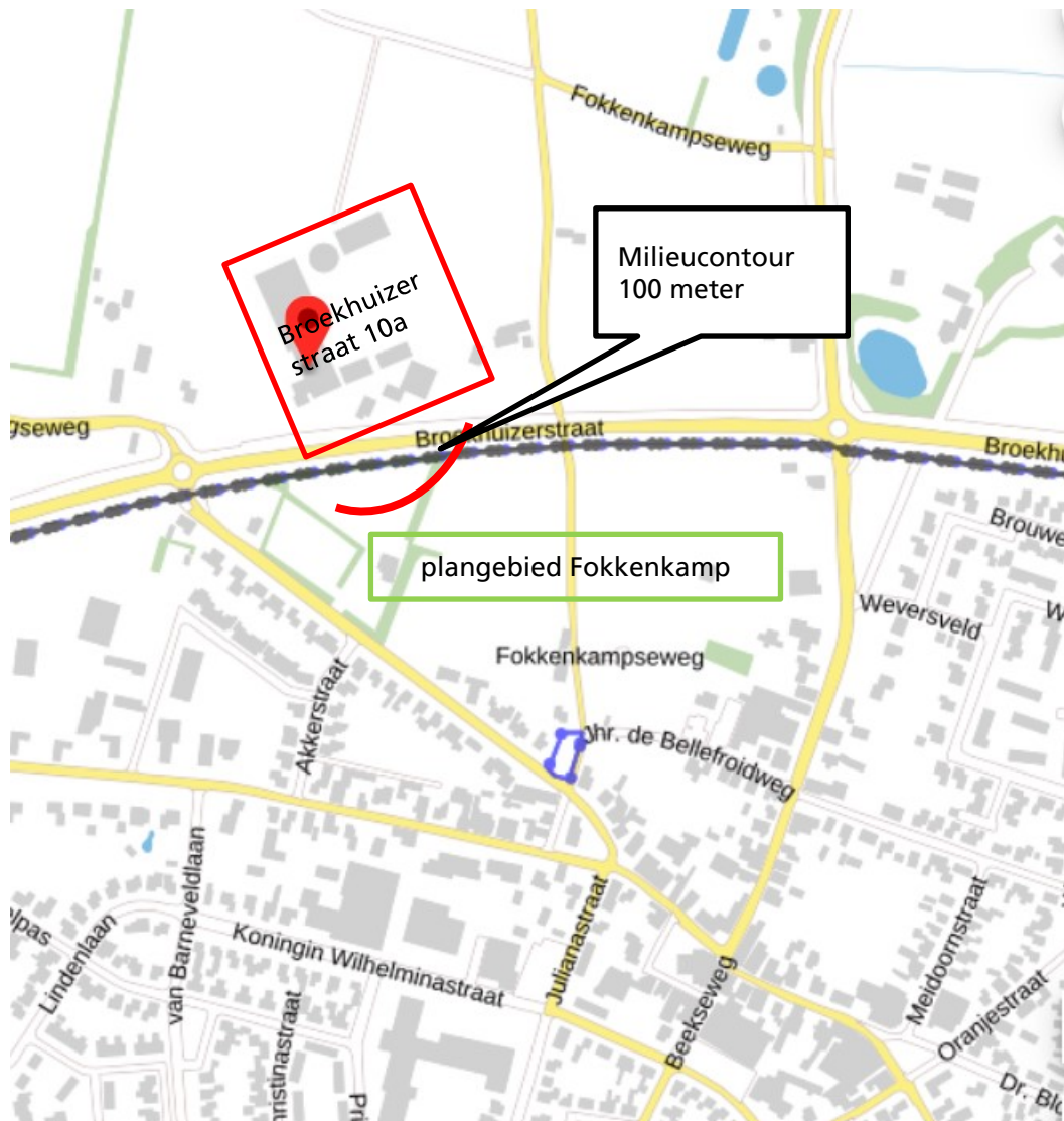
Figuur 5 Broekhuizerstraat 10a met geurcontour in relatie tot plangebied Fokkenkamp