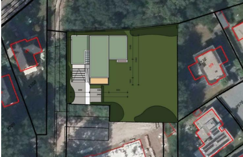
Plattegrond van het plangebied.

Het voornemen bestaat een woning te bouwen in het plangebied. De bomen rondom het plangebied worden mogelijk gesnoeid, maar deze werkzaamheden maken geen onderdeel uit van het te nemen ruimtelijke besluit. Toch worden deze werkzaamheden genoemd in het kader van de zorgplicht.