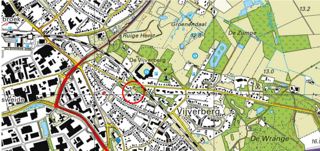
Globale ligging van het plangebied. De ligging van het plangebied wordt met de rode cirkel aangeduid.

Het plangebied is gesitueerd aan de Acacialaan te Doetinchem. Het plangebied ligt ten noorden van het perceel Acacialaan 73. Op onderstaande afbeelding wordt de globale ligging van het plangebied weergegeven op een topografische kaart.