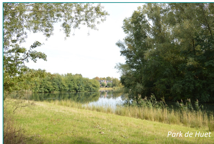
Park de Huet