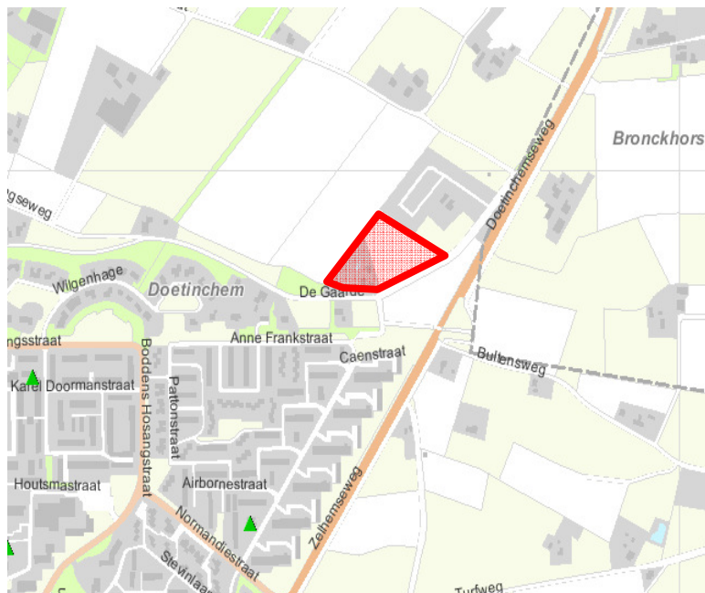
Afbeelding: 4.1: Plangebied (rood), bron: www.risicokaart.nl

In de omgeving van het plangebied zijn geen bedrijven of instellingen aanwezig die een gevaar opleveren voor de veiligheid. Dit is duidelijk te zien op onderstaande afbeelding.