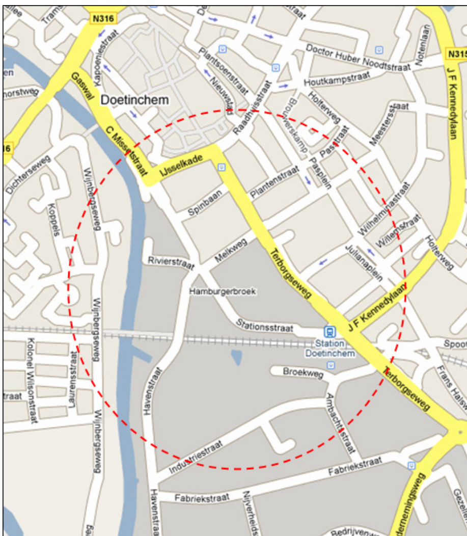
Figuur 1.1: globale begrenzing plangebied herziening bestemmingsplan.

De huidige en toekomstige geluidzone - het plangebied voor de herziening - betreft een groter deel van het stedelijk gebied van Doetinchem dan alleen het bedrijventerrein Hamburgerbroek. Globaal gelegen vanaf de zuidelijke punt van het centrum tot aan de Fabriekstraat op het bedrijventerrein Verheulswede ten zuiden van Hamburgerbroek, de weg Koppels aan de overzijde van de IJssel en de Holterweg in oostelijke richting - zie figuur 1.1.