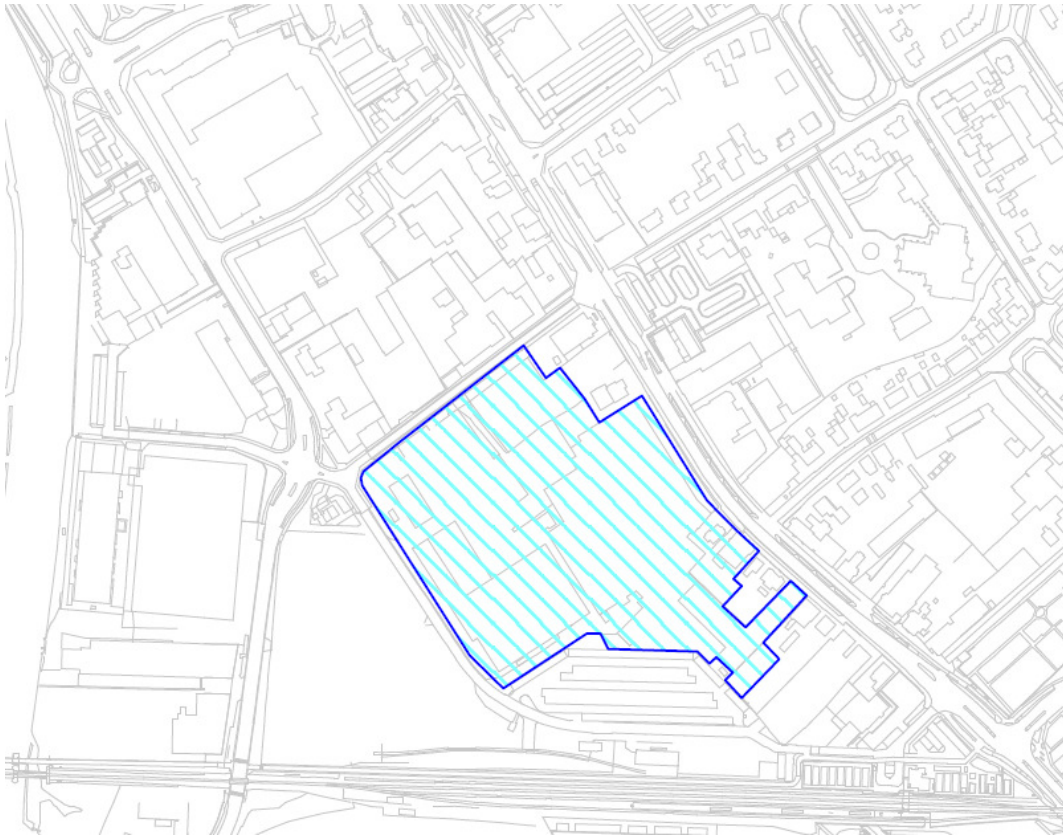
Figuur 4.2: De nieuwe grens van het gezoneerde industrieterrein, tevens de binnengrens van de geluidzone.