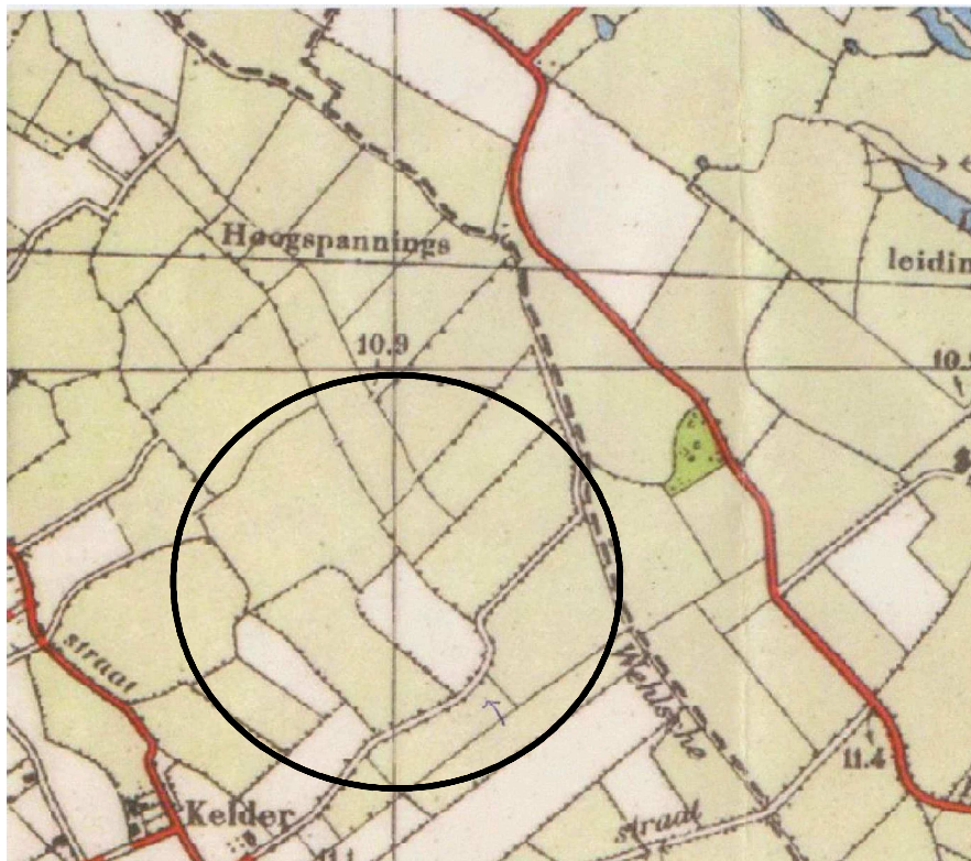
Kaart 3: Situatie 1954. Landschapsinrichting gebied Broekhuizerstraat 2 te Wehl.

De uitgangspunten van het LOP zijn eveneens speerpunten van dit plan. Een van de belangrijkste speerpunten van de inbreiding is het perceel gedeeltelijk in ere te herstellen en in te richten gebaseerd op het landschap in 1954 (zie kaart 3). Hierbij zijn de kaders en doelstellingen van de Wehlse Broeklanden bepalend.