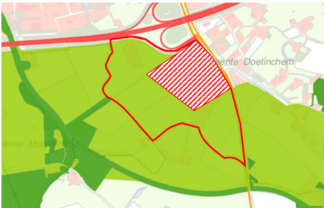
Ligging van het plangebied (rood) in de GO (licht groen) en nabij het GNN (donker groen).