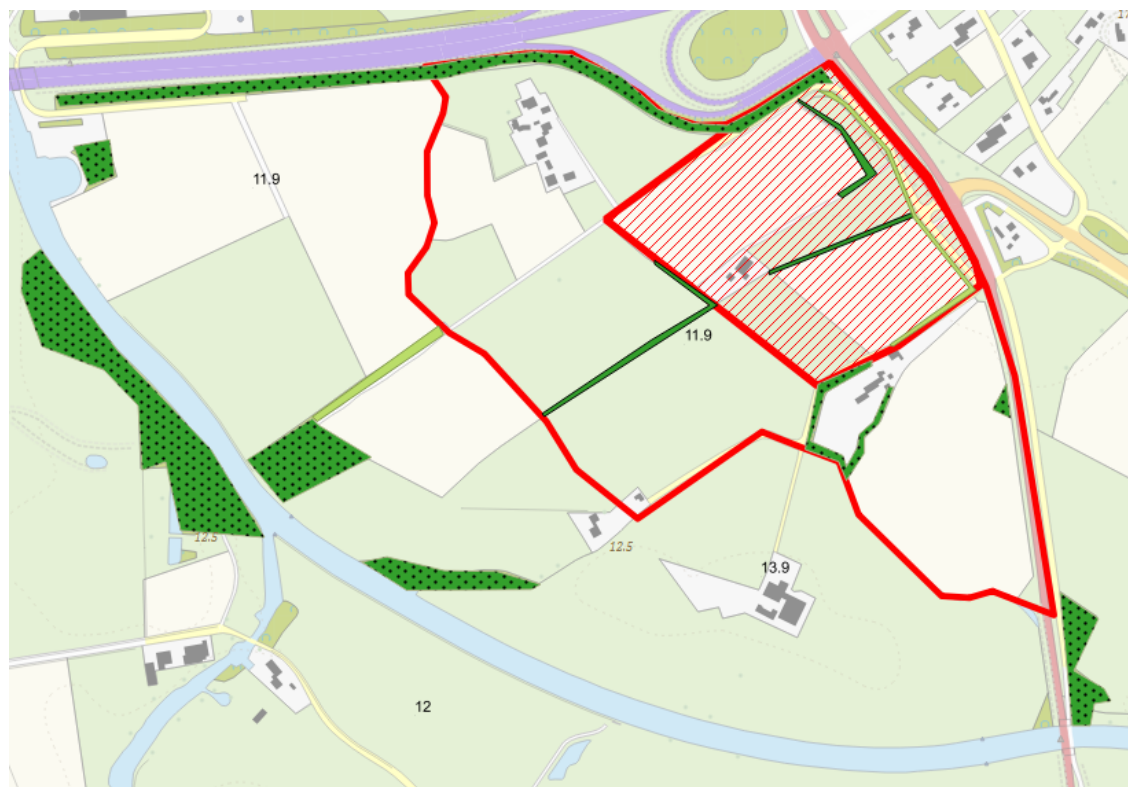
Figuur 3. Versimpelde weergave van de aanwezige ecotopen, als onderdeel van de kernwaarden. In donkergroen gefragmenteerde houtwallen, met bolletjespatroon bosschages en in lichtgroen bomenlaan.

Door de staat van de hagen en het lokaal ontbreken van lijnvormige elementen, heeft het plangebied niet de waarden die het in potentie in zich draagt, zowel op natuur als op landschappelijk vlak. Zie Figuur 3 voor een versimpelde weergave van de aanwezige ecotopen, als onderdeel van de kernwaarden. Hierop is niet zichtbaar wat de kwaliteit van de elementen is.