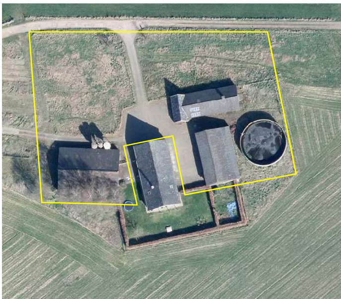
Detailopname van het plangebied. Het plangebied wordt met de gele lijn aangeduid.

Het plangebied bestaat uit een deel van een bestaand voormalig agrarisch erf. Op het erf staan een oude boerderij, twee schuren, een werktuigenberging en een mestbassin. De gebouwen zijn gebouwd met bakstenen en de bijgebouwen zijn gedekt met golfplaat. Aan de voorzijde van de woonboerderij ligt een eenvoudige siertuin met gazon en een beuken scheerhaag. Ten zuiden van de schuur aan de westzijde van de woning zijn berken en vlierstruiken opgeslagen, evenals aan de noord- en oostzijde van de oostelijke schuur. Op onderstaande luchtfoto wordt het plangebied in detail weergegeven.