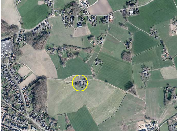
Globale ligging van het plangebied in de omgeving. Het Plangebied wordt met de cirkel aangeduid.

Het plangebied is gelegen op het adres Tuinstraat 6 in Gaanderen. Het ligt in het buitengebied, net ten oosten van de kern Gaanderen. Op onderstaande kaart wordt de globale ligging van het plangebied weergegeven.