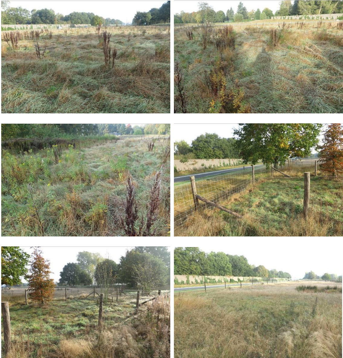
Figuur 3. Aanzicht van de omgeving van het plangebied van het tankstation.