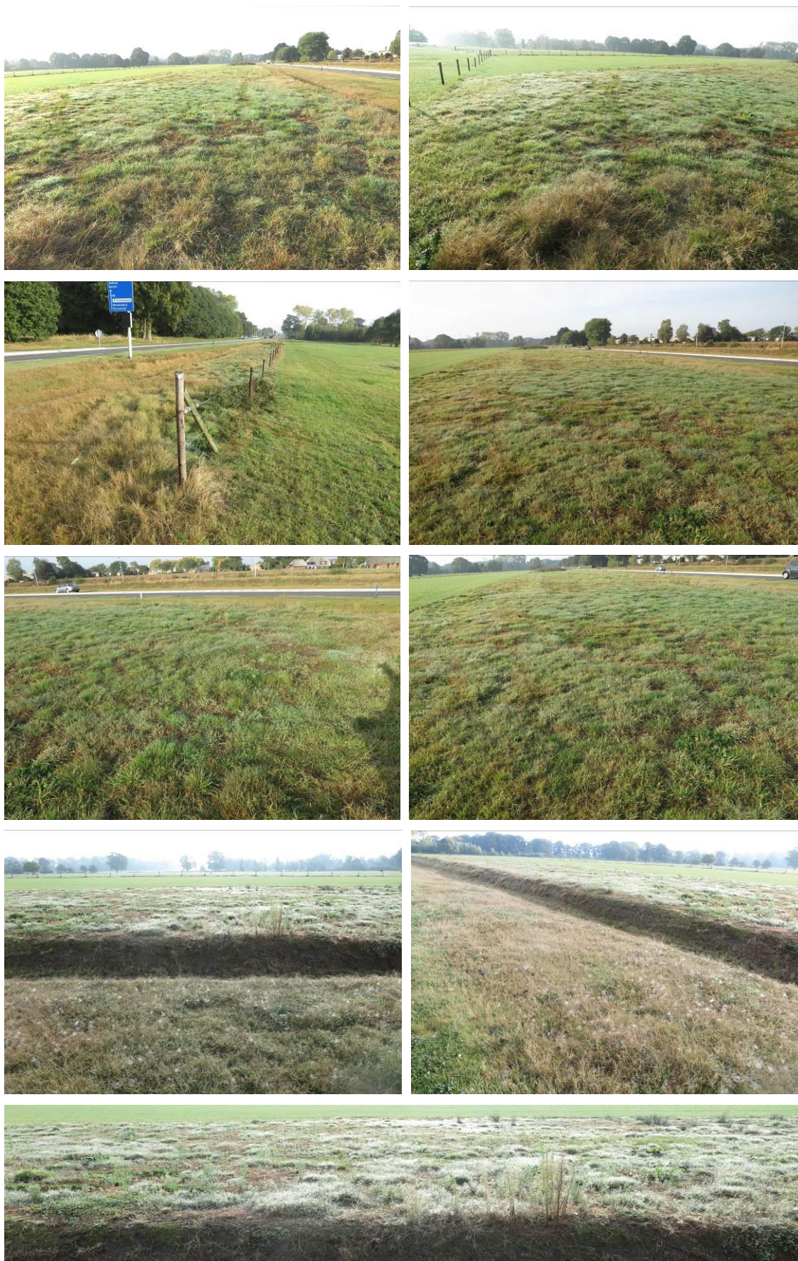
Figuur 2. Aanzicht van het plangebied en directe omgeving van het Tankstation.