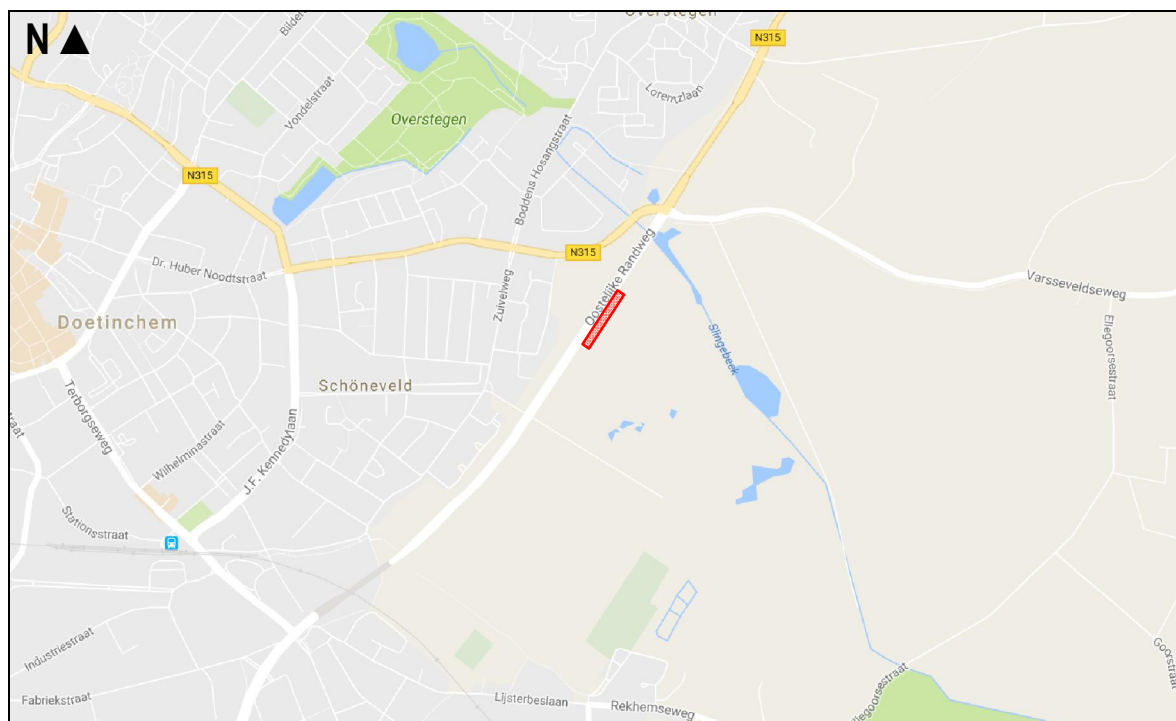
Figuur 1. Globale ligging van het plangebied Tankstation aan de oostelijke rondweg te Doetinchem (rood).

Ten behoeve van de aanleg van het tankstation zal het plangebied bouwrijp worden gemaakt en worden omgevormd tot tankstation met bijbehorende voorzieningenplaats met parkeerplaatsen. In figuur 2 en 3 wordt respectievelijk een beeld gegeven van het plangebied en de omgeving van het plangebied op dinsdag 18 oktober 2016.