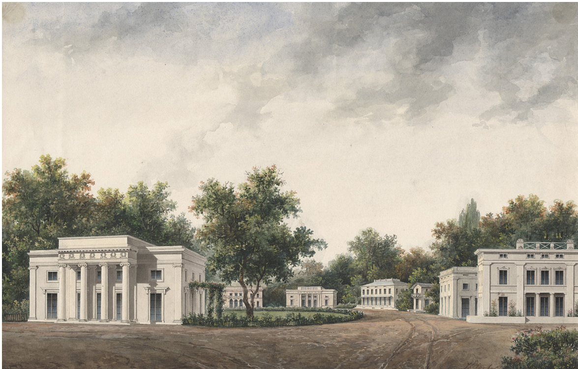
Afb. 8 Presentatietekening voor een villapark, door Jan David Zocher jr. uit 1852 (Collectie NAI, ZOCH 47). In deze tekening combineerde Zocher het in die tijd populaire landschapspark met villabebouwing. Zoals het gebouwtje links, met zuilenportiek, zo zou 'Louisiana' er uit gezien kunnen hebben.

Dat er vóór de bouw van het paviljoen iets anders op deze plek heeft gestaan lijkt niet waarschijnlijk. De enige bebouwing ingetekend op de Hottingerkaart in de directe omgeving is de aangrenzende boerderij Bezelhorstweg 31.