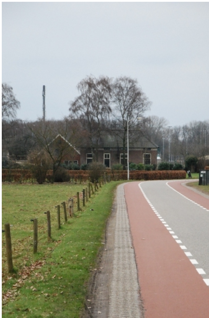
Afb. 21 Bezelhorstweg 31c gezien vanaf de weg (foto is genomen in oostelijke richting).