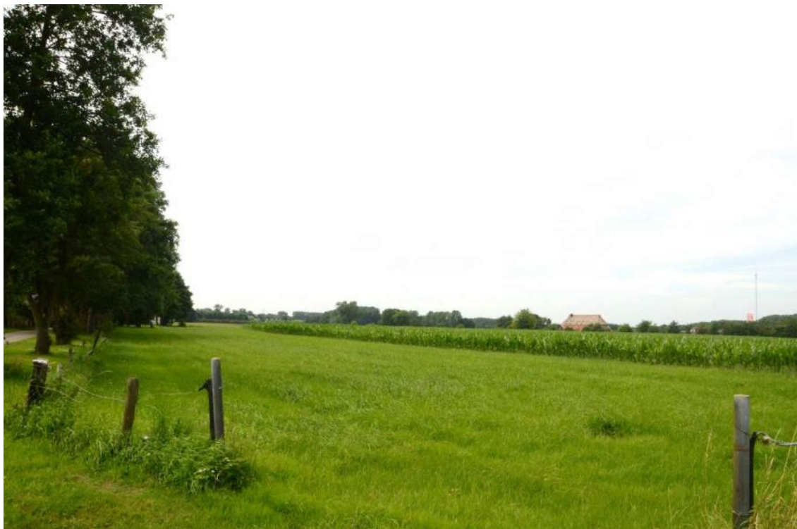
Figuur 4. Zicht op het plangebied, met diverse ecotopen op de foto. Links de laanbeplanting langs de Oudesluisweg, op de voorgrond een grasland en daarachter maïsakker. Aan de horizon is een van de erven in het plangebied zichtbaar.