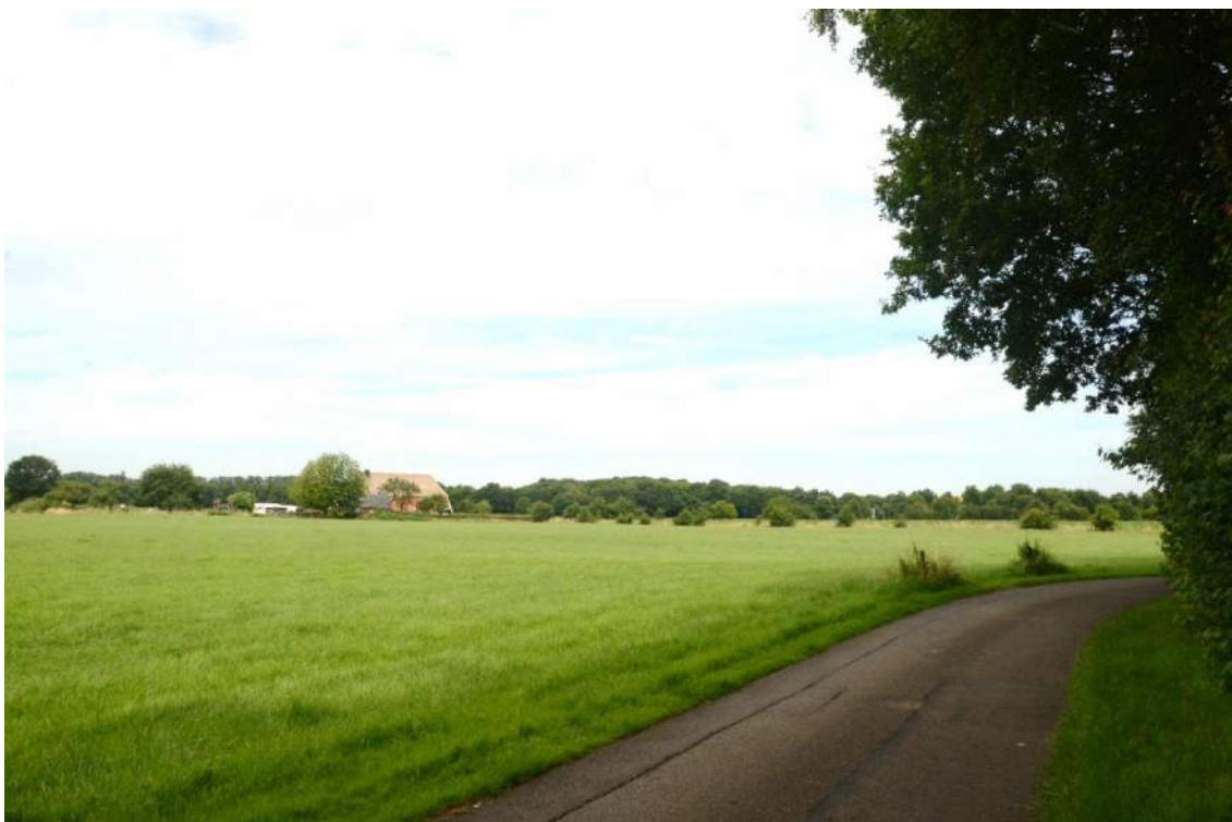
Figuur 7. Dit gangbaar grasland is onderdeel van het onderzoeksgebied, gelegen in de GO. Op deze plek in het onderzoeksgebied, zijn op dit moment geen landschapselementen aanwezig. Op de achtergrond solitaire struiken, als gefragmenteerd lijnelement. Daarachter de bosschages langs de A18.