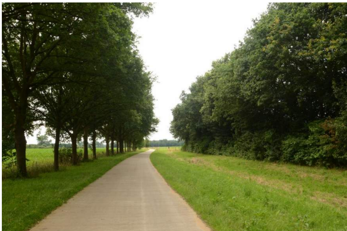
Figuur 5. In het plangebied zijn ecotopen aanwezig welke leefgebied kunnen zijn van diverse zwaarder alsmede strikt beschermde soorten. Lijnvormige elementen, zoals deze bomenlaan langs de Kemnaderallee zijn populaire onderdelen van de functionele leefomgeving van diverse soorten.