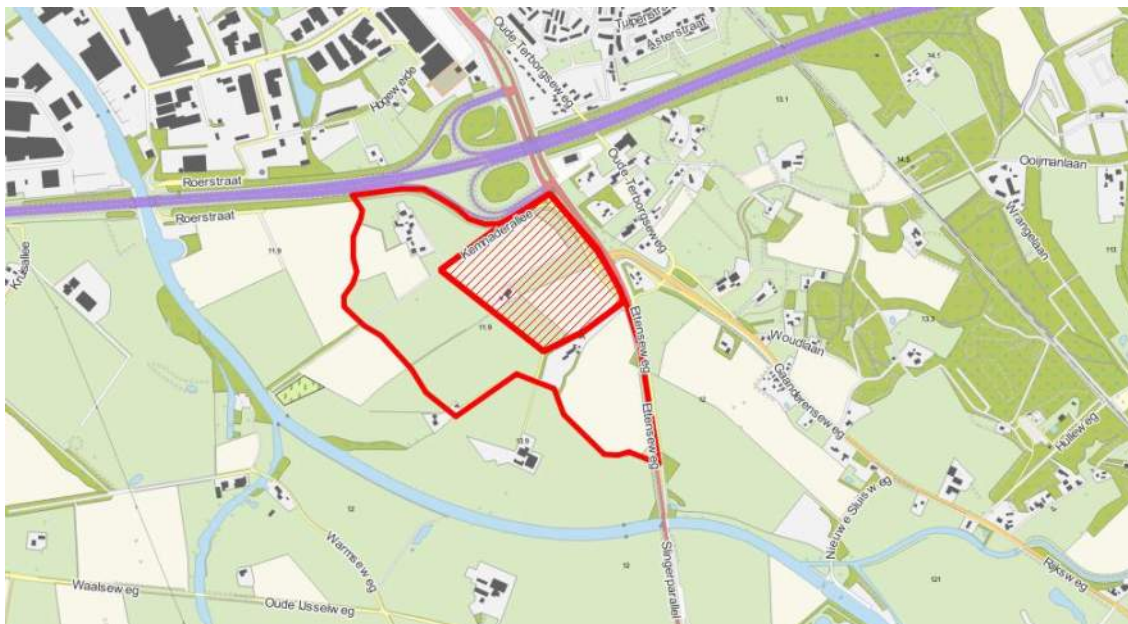
Figuur 1. Ligging van het plangebied, met de begrenzing in rood aangegeven. Het gearceerde deel is het daadwerkelijke plangebied. Het overige deel betreft het ruimere onderzoeksgebied.

Het toekomstige ziekenhuis is gepland nabij Doetinchem, langs de A18 afslag 4 (provincie Gelderland). In Figuur 1 is de begrenzing van het plangebied en van het onderzoeksgebied weergegeven. Het plangebied wordt begrensd door de Kernnaderallee, de Oudesluisweg en het verloop van een ondiepe watergang aan de westzijde. Het onderzoeksgebied wordt begrenst door de A18, de Ettenseweg (N317) en de Harreveldse Tochtsloot (zuidkant) en de Voedingsloot (oostkant). Dit alles is gelegen in de grotere context van het landschap van de Oude IJssel.