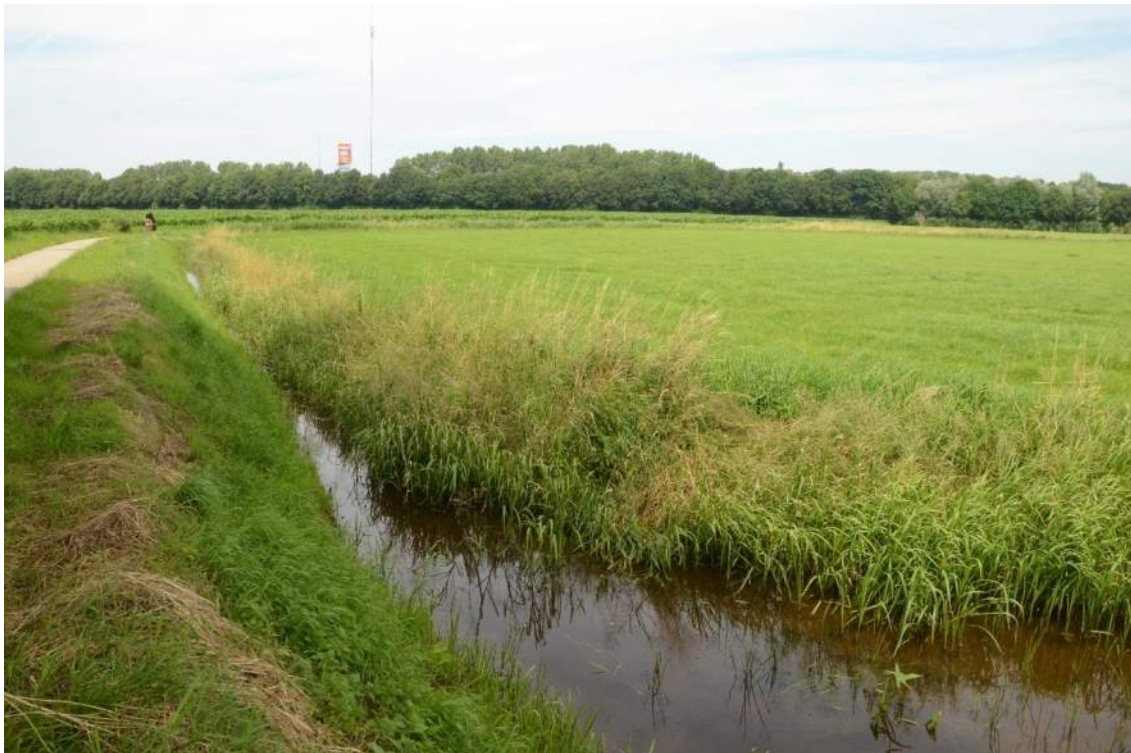
Figuur 6. Het onderzoeksgebied heeft een landschappelijk logische grens, de Harreveldse Tochtsloot (zuidkant) en de Voedingsloot (oostkant). Dit is een historische rivierloop van de Oude IJssel. De huidige rivierloop is iets verder westelijk gelegen. Het bijbehorende landschapstype is gevarieerd, met een afwisseling van open stukken en landschapselementen als hagen, bomenrijen en bosschages.