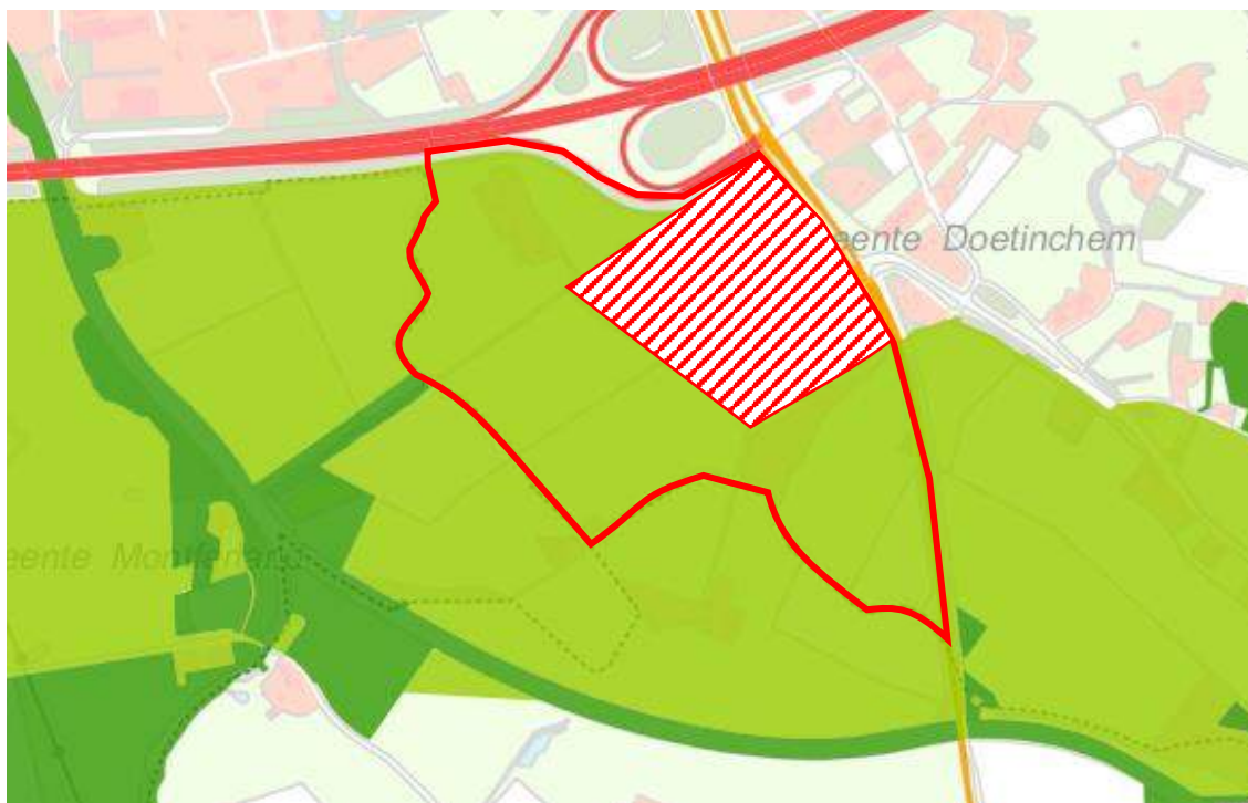
Figuur 2. Ligging van het plangebied (rood) in de Groene ontwikkelingszone (licht groen) en nabij het GNN (donker groen).

Het plangebied bevat geen onderdelen van het Gelders NatuurNetwerk (GNN), hoewel het gebied oorspronkelijk wel onderdeel was van de planologische EHS. Het plangebied is wel gelegen in de provinciale Groene Ontwikkelingszone, zie Figuur 2.