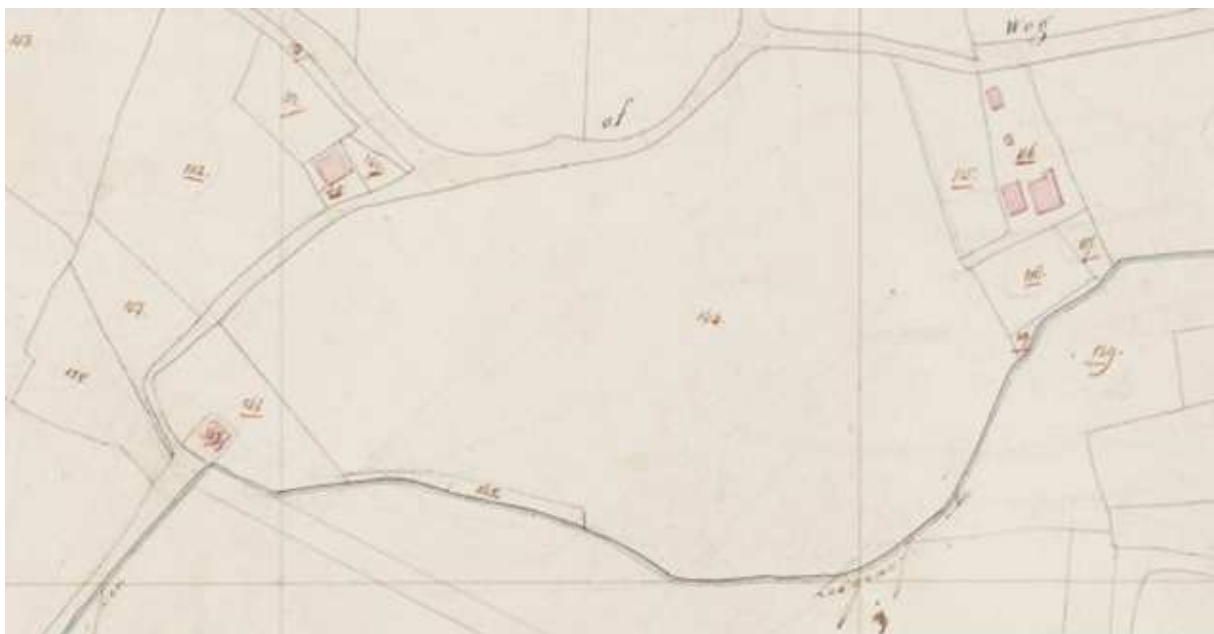
Minuutplan gemeente Wehl, sectie A, nr. 1, 1822