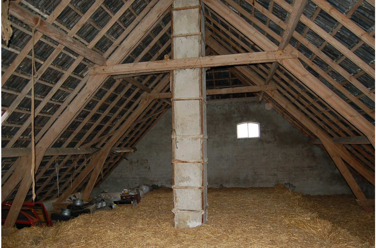
interieur 1 e verdieping/hooizolder veeschuur