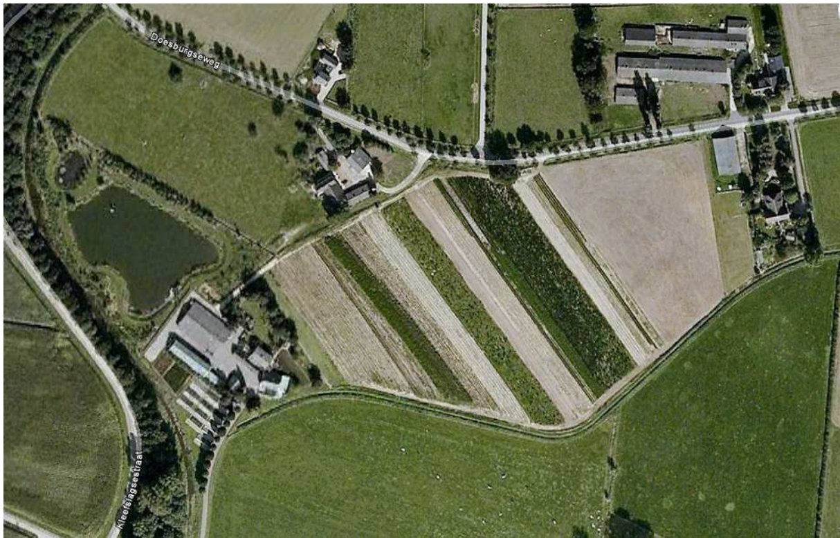
Luchtfoto huidige toestand