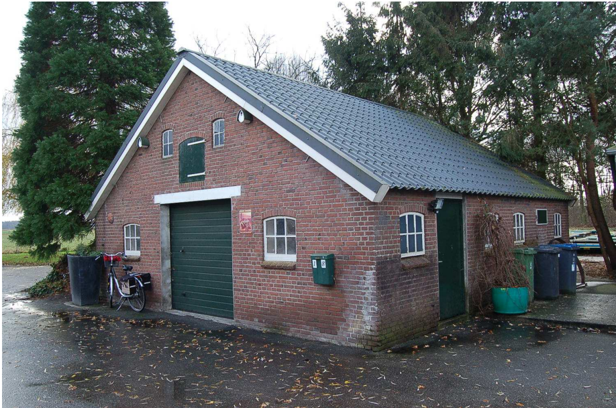
Noord- en westgevel voormalige varkensschuur