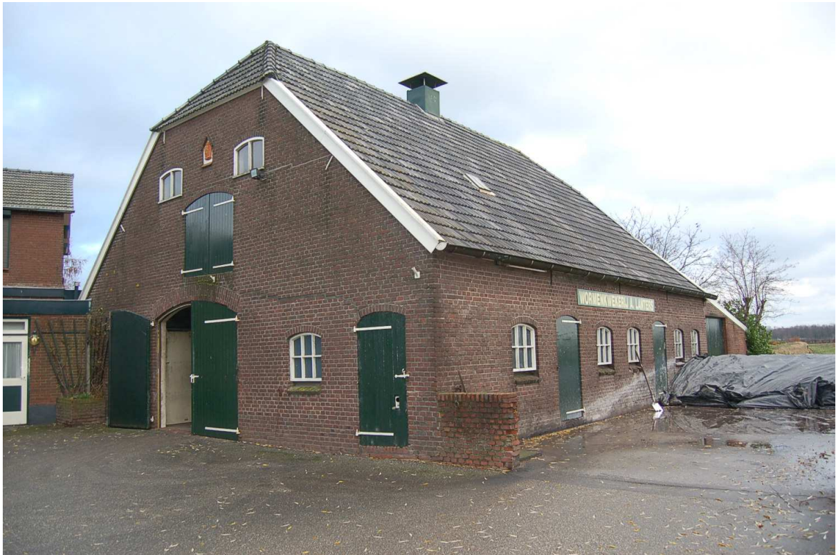
west- en zuidgevel veeschuur