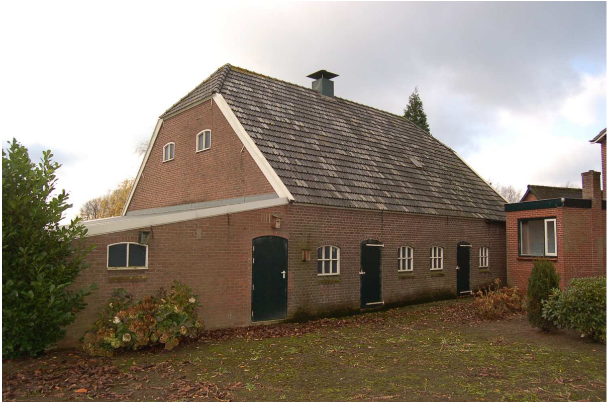
oost- en noordgevel veeschuur