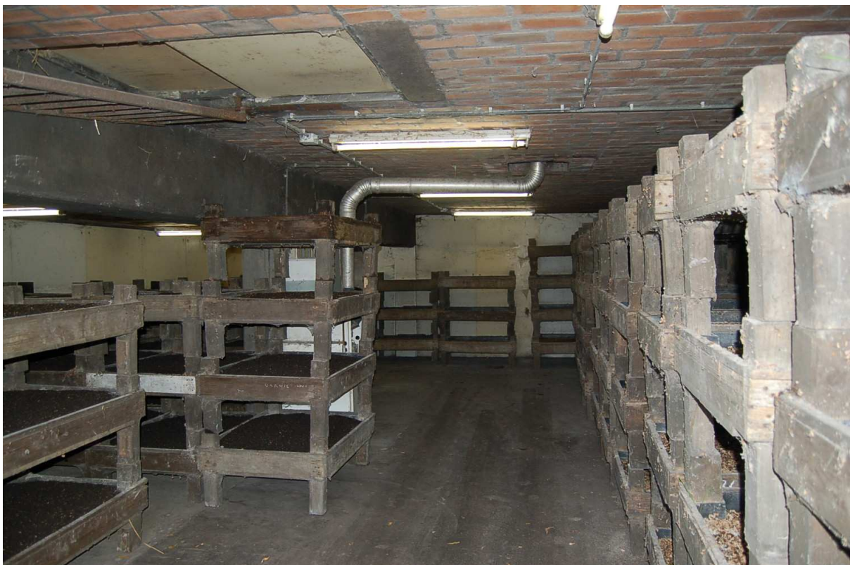
interieur begane grond veeschuur