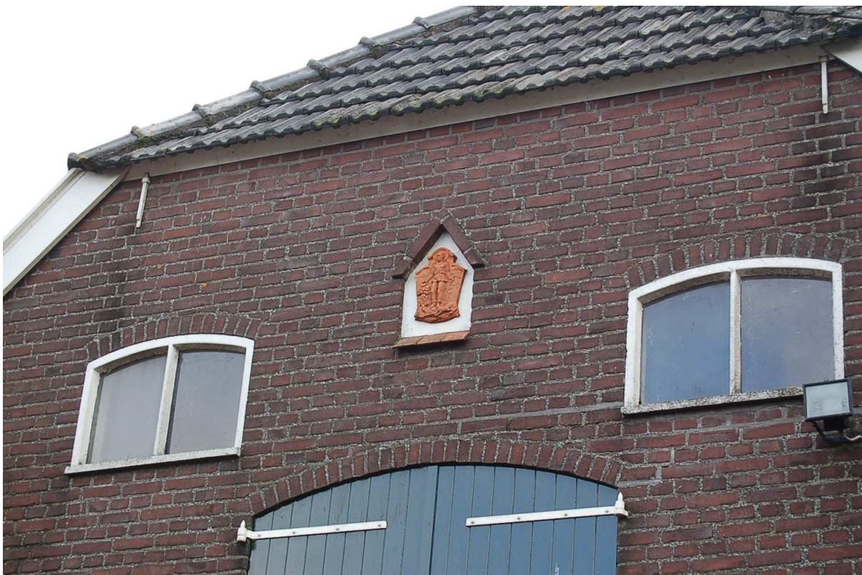
detailopname terracotta afbeelding St. Isidorus