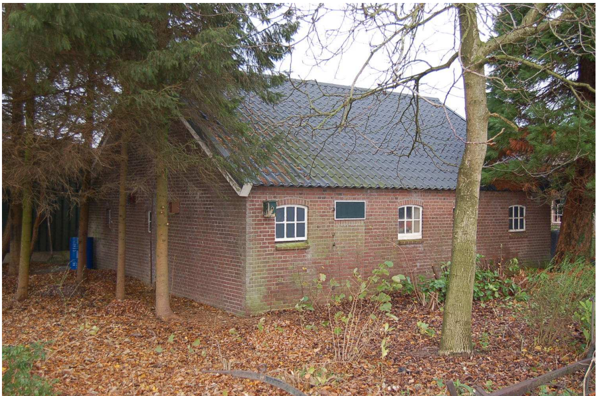
zuid- en oostgevel voormalige varkensschuur