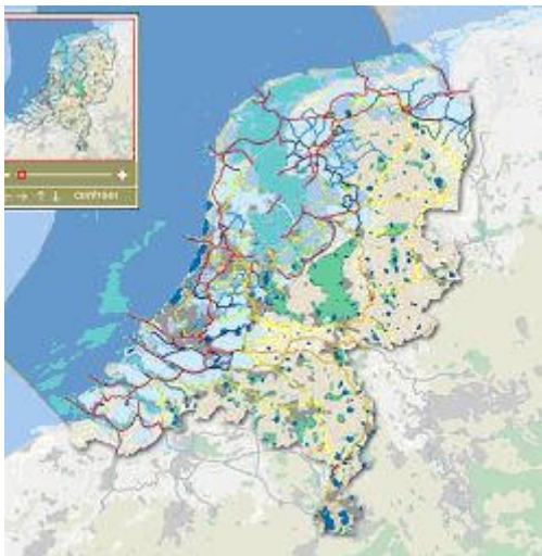
PKB-kaart 8: Overige thema's

Naast de EHS is voor de gemeente Doetinchem de recreatietoervaart van belang. Op de planologische kernbeslissing kaart 'Overige thema's' staat bij recreatietoervaart Nederland de Oude IJssel aangewezen als ontsluitingswater voor motorboten. Provincies en gemeenten beschermen en versterken de routenetwerken voor wandelen, fietsen en recreatietoervaart. Het basisrecreatietourvaarnet dient door de gemeente opgenomen te worden in het bestemmingsplan.