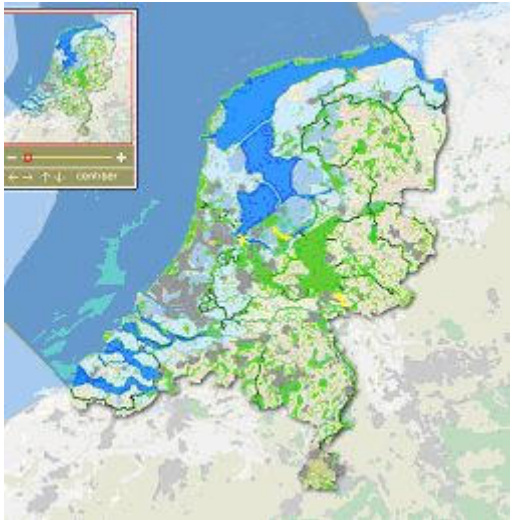
PKB-kaart 5: Ecologische hoofdstructuur

Naast de EHS is voor de gemeente Doetinchem de recreatietoervaart van belang. Op de planologische kernbeslissing kaart 'Overige thema's' staat bij recreatietoervaart Nederland de Oude IJssel aangewezen als ontsluitingswater voor motorboten. Provincies en gemeenten beschermen en versterken de routenetwerken voor wandelen, fietsen en recreatietoervaart. Het basisrecreatietourvaarnet dient door de gemeente opgenomen te worden in het bestemmingsplan.