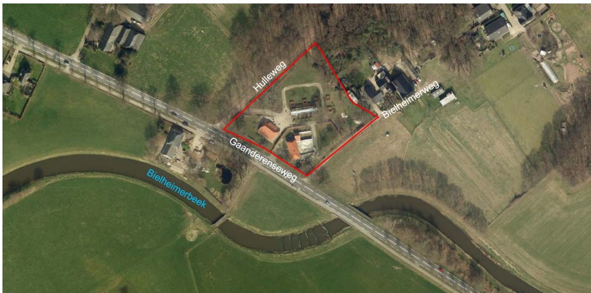
Ligging plangebied met globale plangrens

Het plangebied ligt aan de Gaanderenseweg 381 in Doetinchem. Het plangebied wordt begrensd door de Gaanderenseweg, Bielheimerweg en de Hulleweg.