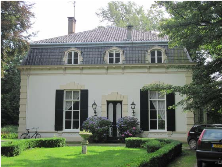
Wehl in Oude Ansichten; .