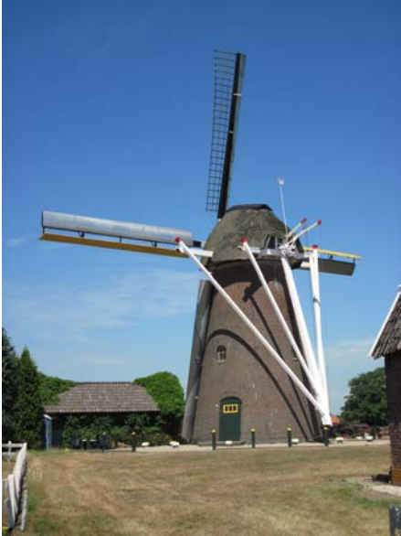
Wehl in Oude Ansichten; .