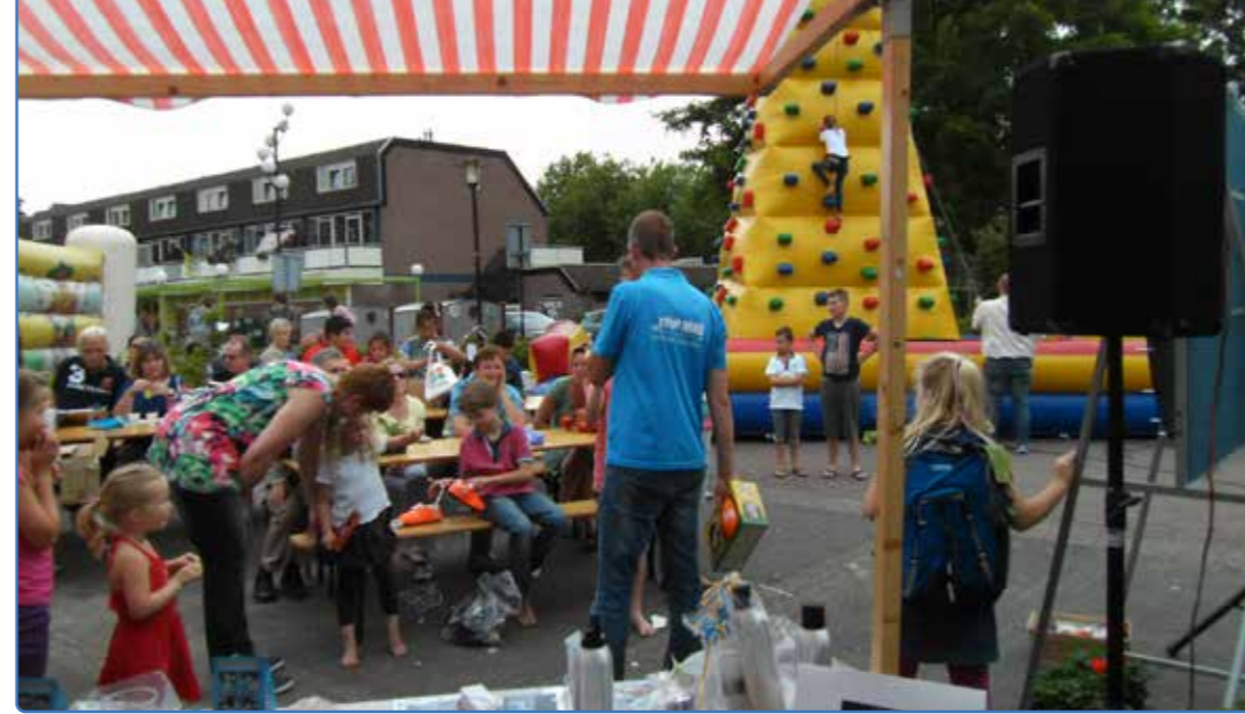
Een van de eerdere feesten op de Zwaluwenburg

Dit gedeelte kun je opsturen naar WijDeventer. Er wordt dan contact met je opgenomen om te vragen of je direct aan de slag kunt of dat je iets nodig hebt om je idee verder uit te werken en uit te voeren.