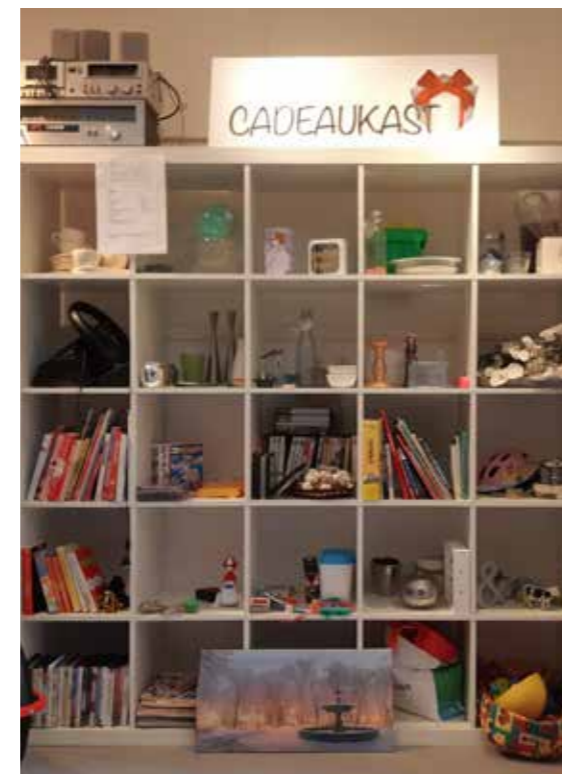
De cadeaukast in Verbindingscentrum De 5Hoek