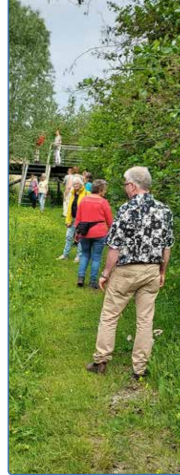
Wandelgroep 'En Route' in de Vijfhoek

Recent is in de Vijfhoek wandelgroep 'En Route' van start gegaan. Met tot nu toe 24 aanmeldingen hebben ze een succesvolle start. Donderdag 20 mei was de eerste wandeling. Een kennismakingswandeling met leuke, gezellige, interessante mensen en..... mooi weer. De deelnemers waren enthousiast en sommigen verrast door de mooie plekken in de buurt. In het Verbindingscentrum De 5Hoek werden ze gastvrij getraakteerd op een kopje koffie met koekjes. Inmiddels hebben er verschillende korte en lange afstandswandelingen plaatsgevonden. Tijdens het wandelen komen vanuit de deelnemers allemaal ideeën over komende wandelingen en wordt er aandacht besteed aan de flora en fauna. De korte afstandswandeling is op donderdagochtend om 9.45 uur, verzamelen bij het Verbindingscentrum De 5Hoek aan het Andriessenplein. De lange afstandswandeling is op vrijdagochtend om 10.00 uur, het verzamelpunt varieert. "En Route" gaat door, zij blijven wandelen in het hart van Salland en wie weet..... daar buiten.