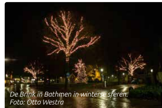
De Brink in Bathmen in winterse sferen.

De Stichting Bathmen Promotie kreeg het voor elkaar om het project verlichting op de Brink uit te voeren. Met een aantal subsidies, waaronder een bijdrage van WijDeventer, Vitaal Platteland en het Rabo Coöperatiefonds, konden een aantal bomen op De Brink worden voorzien van verlichting. Het was een grote wens om vooral in die tijd, waarin de coronamaatregelen nog veel beperkingen oplegden, toch wat warmte en sfeer te creëren. En dat is goed gelukt.