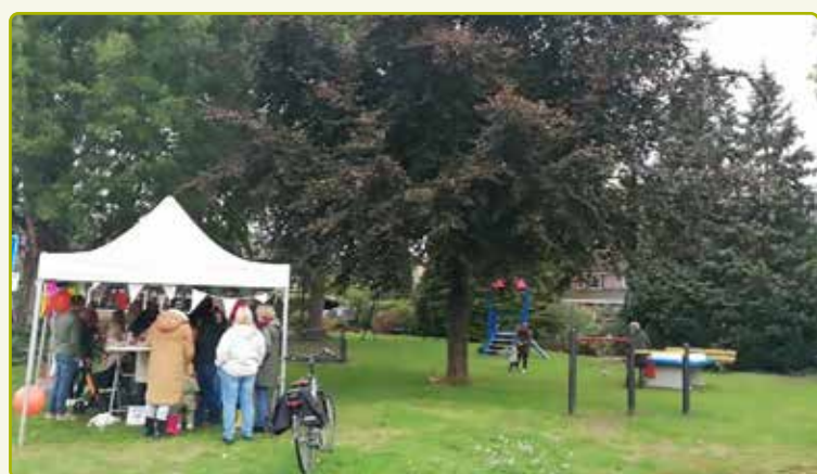
Officiële opening van de speelplek Laarmanskamp

Zaterdag 24 september werd de nieuwe speelplek aan de Laarmanskamp officieel in gebruik genomen. Deze speelplek stond al even op de lijst voor meerjarig onderhoud. De toestellen waren nodig aan vervanging toe. Bewoners dachten mee over het herstel en opnieuw inrichten. De kinderen en buurtbewoners zijn heel enthousiast over de speelplek.