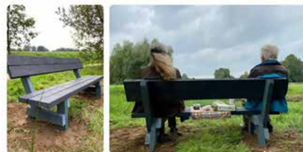
Lekker uitrusten op een bankje aan de Schipbeek