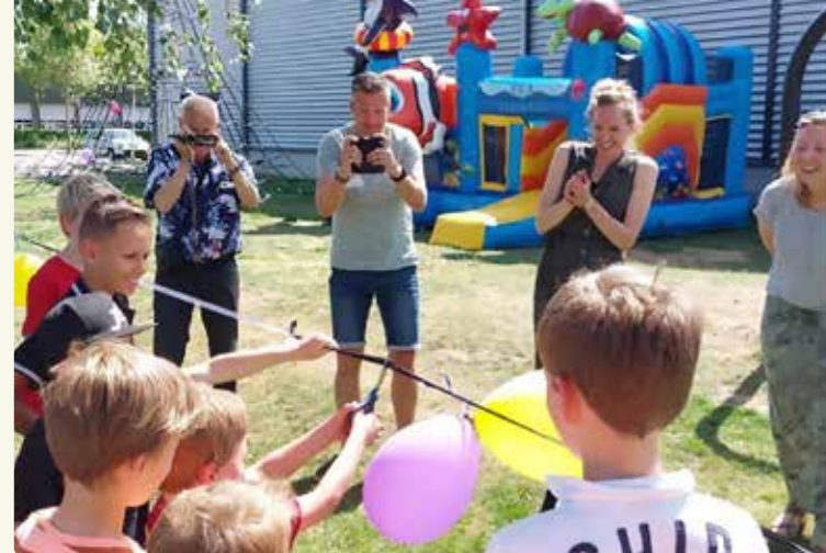
Kinderen uit de buurt Westenberg Buiten knippen het lint door van hun nieuwe speelplek bij de sporthal