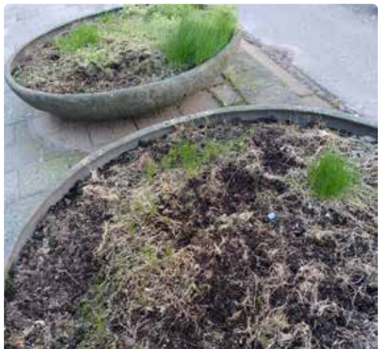
Zo was het

Bewoners van de Pikeursbaan hebben samen het onderhoud van de twee bloemschalen ter hoogte van de bussluis overgenomen. Meerdere burens hielpen mee: een aanvraag indienen bij WijDeventer, inkopen doen en natuurlijk het leeghalen en opnieuw inplanten van de schalen. Het was leuk om samen te doen en het regende complimenten van voorbijgangers.