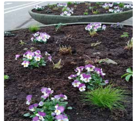
Zo is het nu