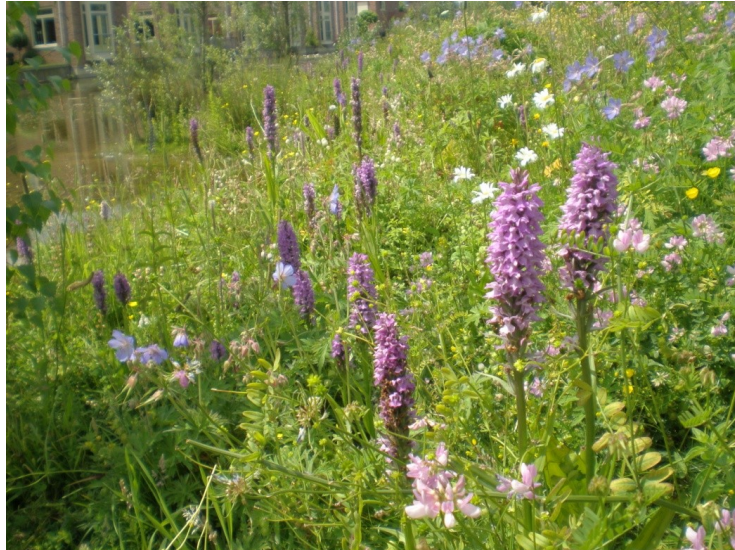
De Gevlekte rietorchis als ambassadeur voor zowel de stedelijk leefomgeving als het landelijke gebied.