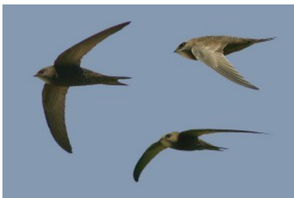
Gierzwaluwen, ook ambassadeurs voor de natuur in de bebouwde omgeving.