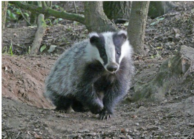
De Das, ambassadeur voor natuur in het buitengebied

In dit laatste hoofdstuk geven we enige richting aan de dialogen op locatie, voortbouwend op de in juni 2009 door de gemeenteraad vastgestelde “Visie Duurzaam Deventer”. We benoemen twintig punten die de dialogen kunnen voeden. We maken daarbij onderscheid naar (1) de inrichtingdialoog, (2) de beheerdialoog en (3) de dialoog rond natuurambassadeurs.