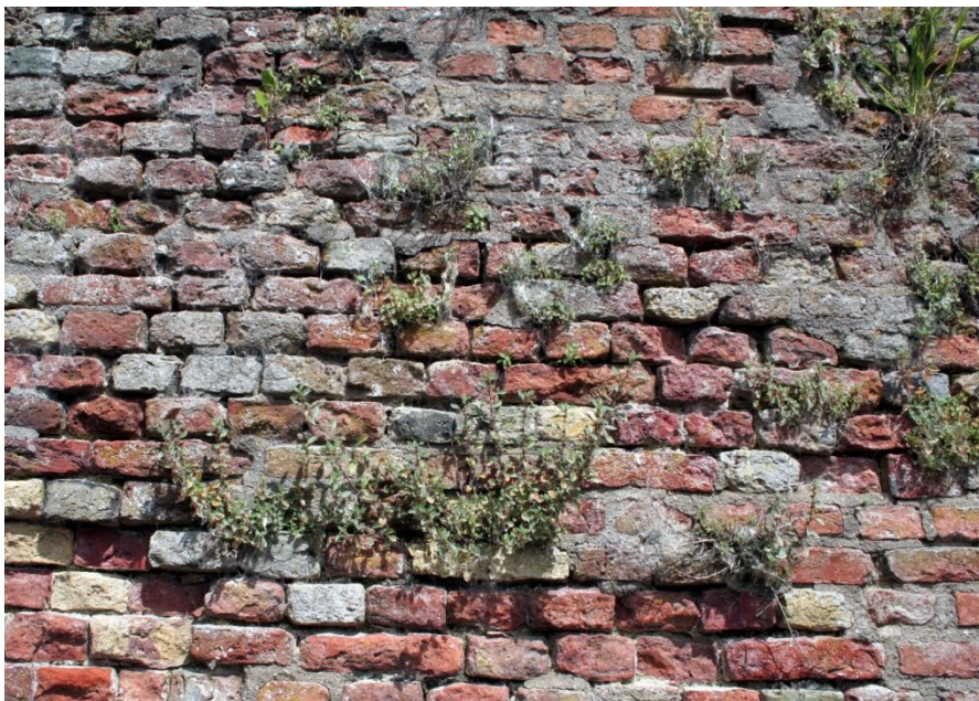
Muurplanten, de derde groep van ambassadeurs voor de bebouwde omgeving.