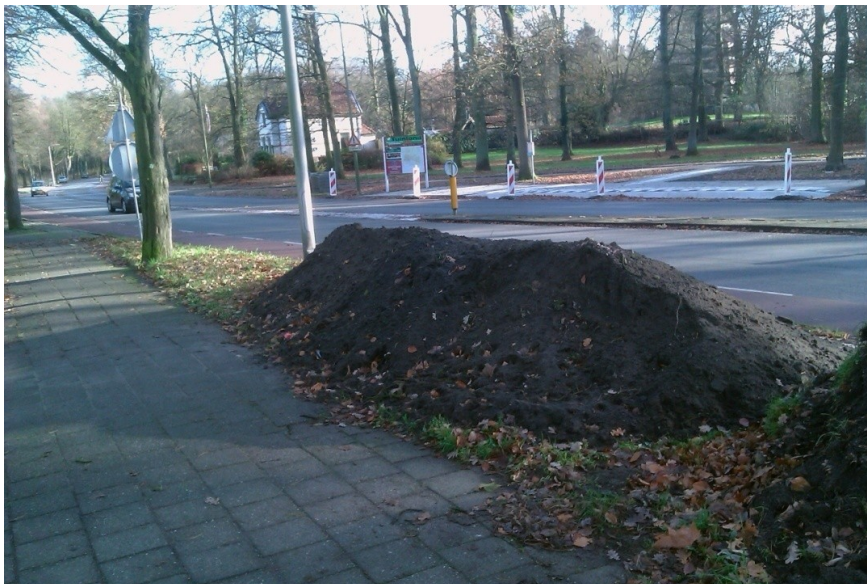
De locatie waar de zeer zeldzame Akkergeelster voorkomt. Drie dagen na ons veldbezoek op 10 november is er een laag grond op gelegd.