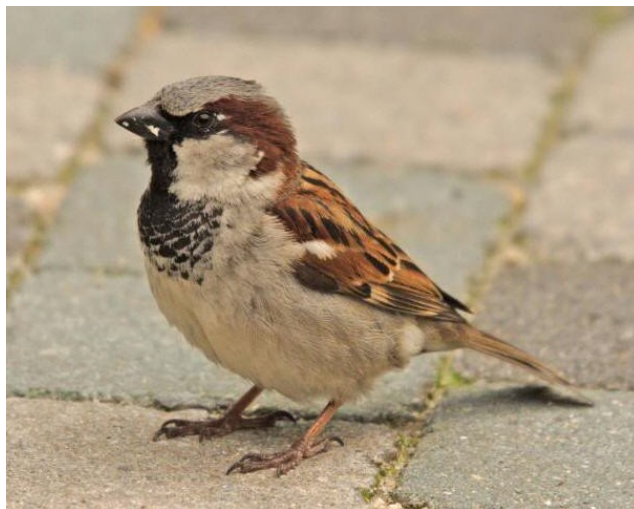
Huisvlieg, ambassadeur voor natuur in de bebouwde omgeving.