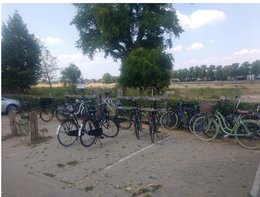
Huidige situatie fietsparkeren achterzijde IJsselhotel

Rondom het parkeerterrein van de camping het IJsselhotel staan gedurende zomer veel fietsers tussen en rondom de auto's, daarnaast blokkeren zij deels de entree tot het gebied (zie hieronder een foto). In 2019 wordt daarom een nieuwe fietsenstalling gerealiseerd in een vergelijkbare uitstraling als het toegangshek i.c.m. nieuwe milieuwand.