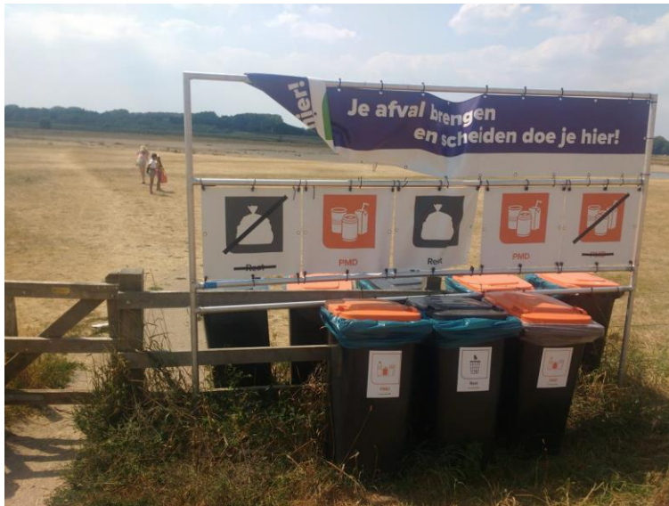
Milieuwand zijde Zandweerd

Ter hoogte van de twee milieuwanden wordt er dit jaar ook een pilot gedraaid, waarbij de mogelijkheid is om afvaltasjes mee te nemen het gebied in. Dit op basis van positieve ervaringen van een vergelijkbare aanpak bij de Waalstrandjes in Nijmegen. In Nijmegen heeft dit zelfs tot gevolg gehad dat bezoekers geïnspireerd zijn geraakt om zelf tasjes van huis mee te nemen.