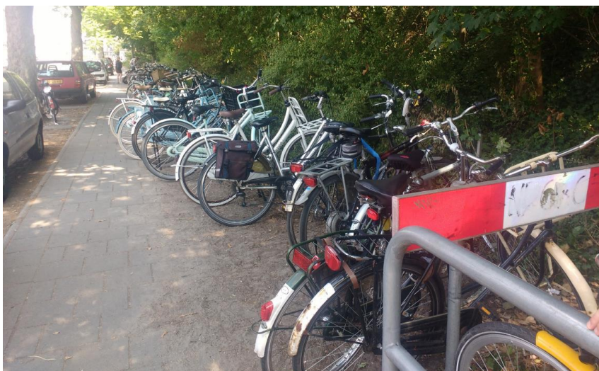
Huidige situatie opgang Zwarte Pad/Ossenweerdstraat

Ter hoogte van deze opgang wordt in 2019 een deel van de groenstrook naast het trottoir ingericht met fietsenrekken. Tevens wordt hier een bord en een afvalbak geplaatst.