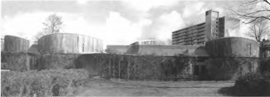
afbeelding 3 De Maranathakerk gevel aanzicht