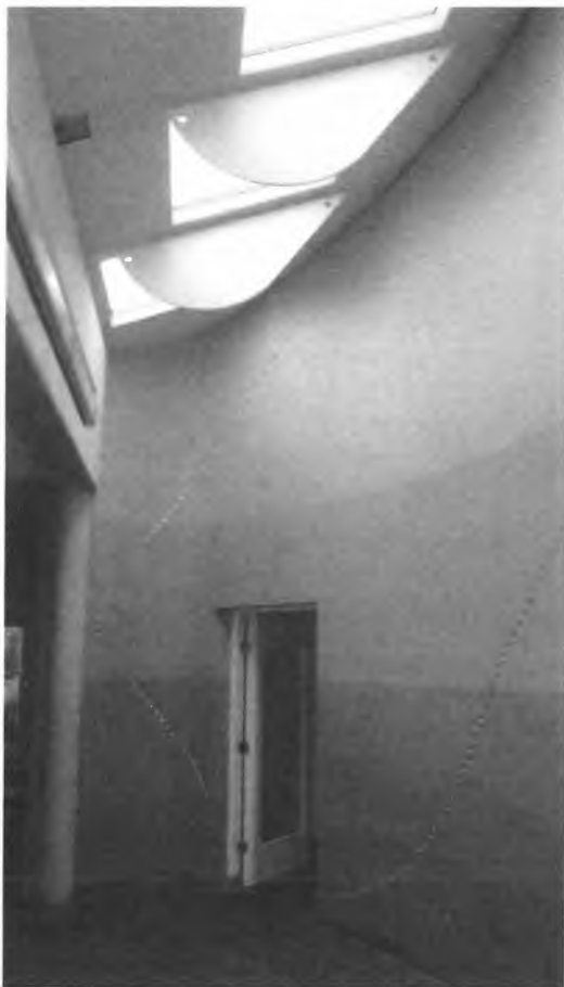
afbeelding 2 De blauw geverfde muren met bovenverlichting met daarop een deel van het kunstwerk Flying Lines

De kerk, gelegen aan het Maranathaplein, ligt verscholen op een binnenterrein in Keizerslanden. De kerk bestaat uit twee delen die verbonden zijn door een binnenstraat. De kerk heeft 1 bouwlaag onder een plat dak. Het ene deel bevat de kerkzaal en in het andere deel zijn vergaderruimten en dienstvertrekken ondergebracht. De kerkzaal heeft een plattegrond van twee over elkaar kruisende vierkanten waarbinnen 4 overlappende circels zijn geplaatst die de buitenwanden van de kerk vormen: halfronde uitbouwen met bovenlichten. Doordat de circels elkaar op verschillende manieren overlappen heeft de kerk geen echt centrum. De kerk is niet axiaal ingericht, zoals bij veel kerken gebruikelijk, maar polycentrisch, met meerdere aandachtscentra en liturgische brandpunten. In dit