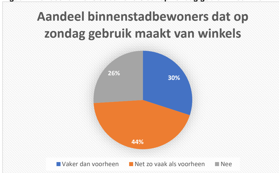
Figuur 1 Aandeel binnenstadsbewoners dat op zondag gebruik maakt van winkels

Aan de bewoners is allereerst gevraagd of ze sinds de invoering van de nieuwe zondagsopeningstijden op zondag wel eens gebruik maken van de winkels in de binnenstad. De volgende figuur laat zien dat in totaal 74% van de binnenstadsbewoners op zondag gebruik maakt van de winkels, 26% doet dat niet. Van de bewoners die op zondag winkelen doet 44% dat net zo vaak als voorheen en 30% vaker dan vóór de verruiming van de zondagopenstelling.