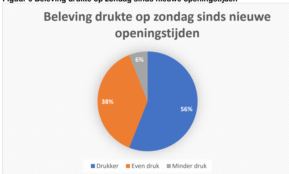
Figuur 6 Beleving drukte op zondag sinds nieuwe openingstijden

In de ogen van ruim de helft van de binnenstadbewoners (56%) is het op de zondagen drukker geworden sinds de invoering van de nieuwe zondagsopeningstijden. Volgens 6 procent is het minder druk dan voorheen, 38% ervaart het als even druk.