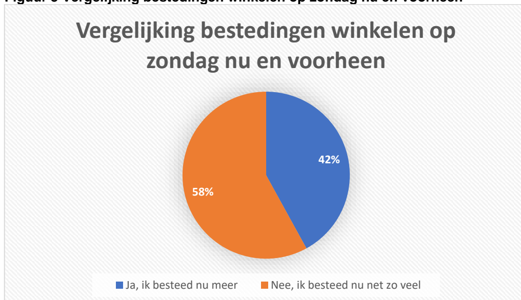
Figuur 3 Vergelijking bestedingen winkelen op zondag nu en voorheen

Van de binnenstadbewoners die nu vaker dan voorheen op zondag winkelen, besteedt 42% ook meer dan voorheen. 58% besteedt nu net zo veel als voor de invoering van de nieuwe zondagsopeningstijden. De zondagsopeningstijden worden vooral gebruikt om boodschappen te doen (62%). Zes procent gaat vooral winkelen (bijv. mode/kleding, in en om het huis, hobby en sport en spel), 32% doet beide (boodschappen en winkelen).