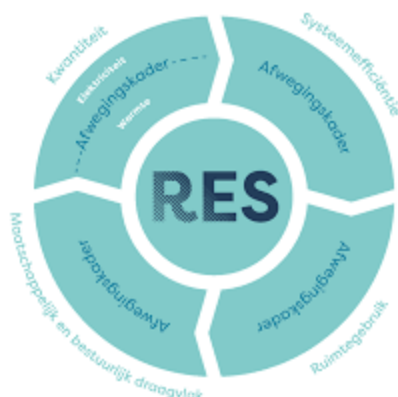
Figuur 1. Afwegingskader RES

In de visie is aangegeven dat richting uitvoering het onderwerp duurzaamheid en energietransitie verder uitgewerkt wordt. De RES is een van deze uitwerkingen.