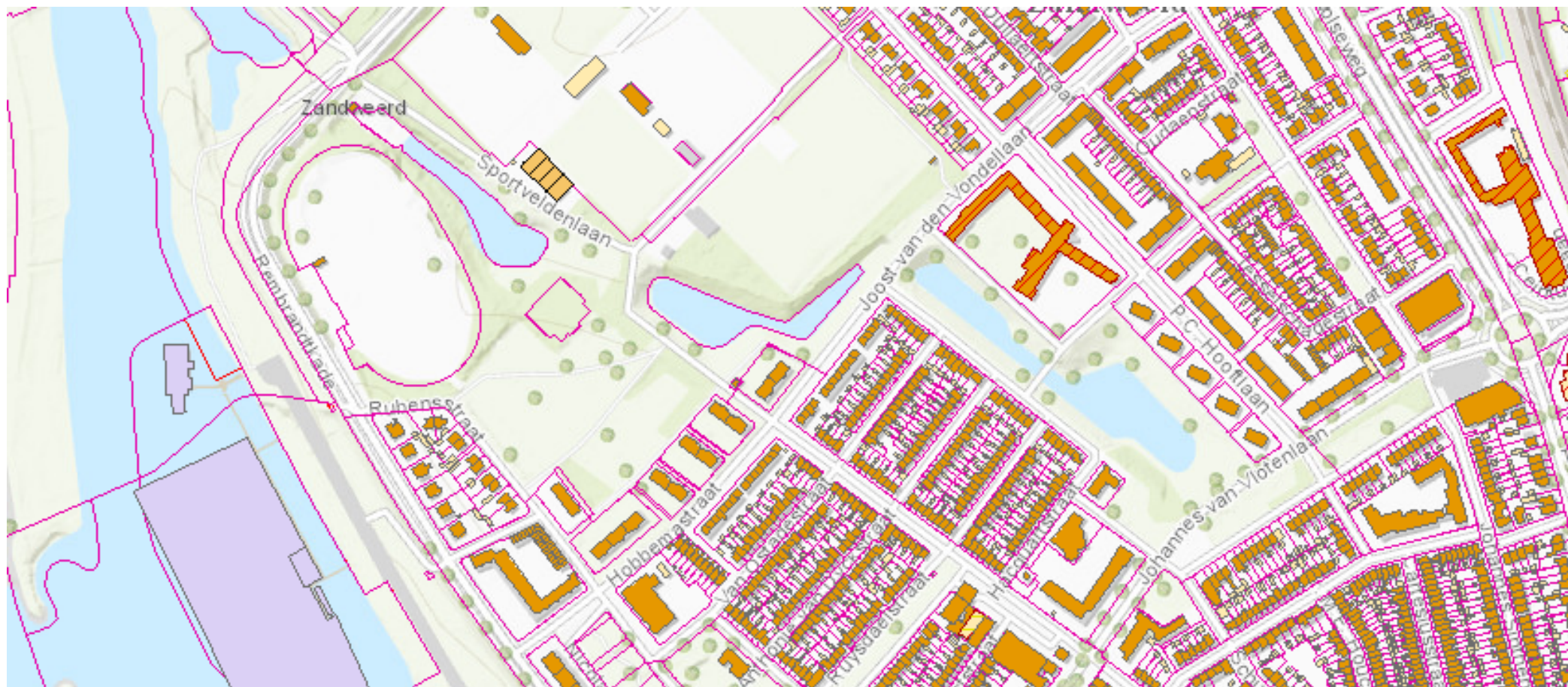
Bestaande situatie 'Tuinen van Zandweerd'