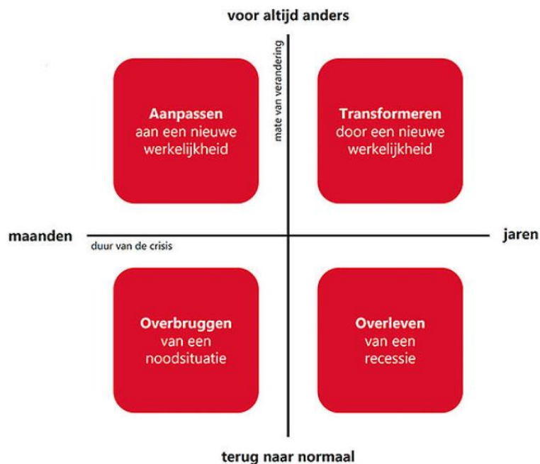
Figuur 1: model scenariogedreven benadering

Om de verdere strategie te bepalen wordt gebruikt gemaakt van het volgende model van Paul de Ruijter, specialist in scenarioplanning: