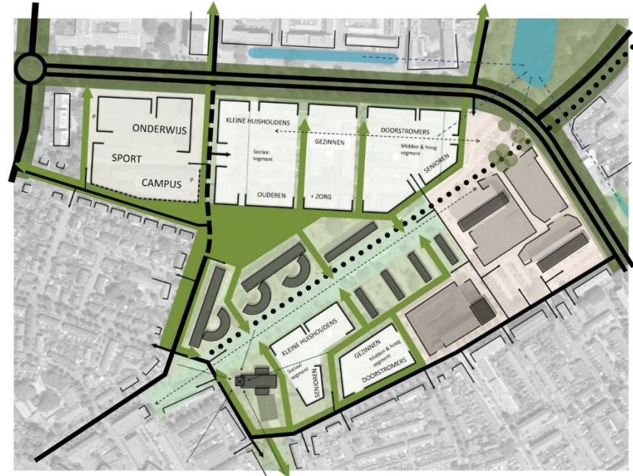
Plankaart Keizerslanden Centrum (Ruimtelijke verkenning Keizerslanden 2020)

Vanuit de Woningbouwopgave Keizerslanden is het de bedoeling om de Van Hetenlocatie te herontwikkelen naar woningbouw. Tot op heden is deze woningbouwambitie niet gerealiseerd en zijn de schoolgebouwen blijven staan en tijdelijk ingevuld met andere functies. De opgave is nu om alsnog op deze locatie van de drie schoolgebouwen op een passende manier de geprogrammeerde woningbouw en maatschappelijke buurtfuncties te realiseren.