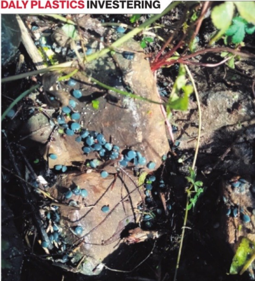
◀ De plastic korrels op de oever van de IJssel bij Zutphen.