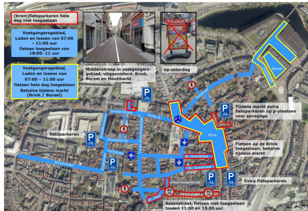
Verkeersmaatregelen COVID-19 binnenstad Deventer vanaf 12 oktober 2020

Ivm mogelijke rellen agv corona maatregelen zijn veel hekken en is bebording verwijderd. Nog niet teruggeplaatst.