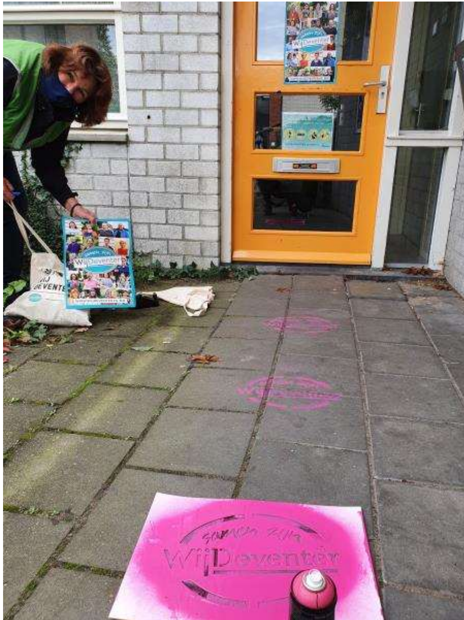
19 - In oktober was de WijDeventer campagne. In Colmschate Zuid is hier aandacht aan besteed door het verspreiden van de flyers en ideeënkaarten. Opbouwwerk en wijkmanager zijn samen de wijk in gegaan om WijDeventer onder de aandacht te brengen.