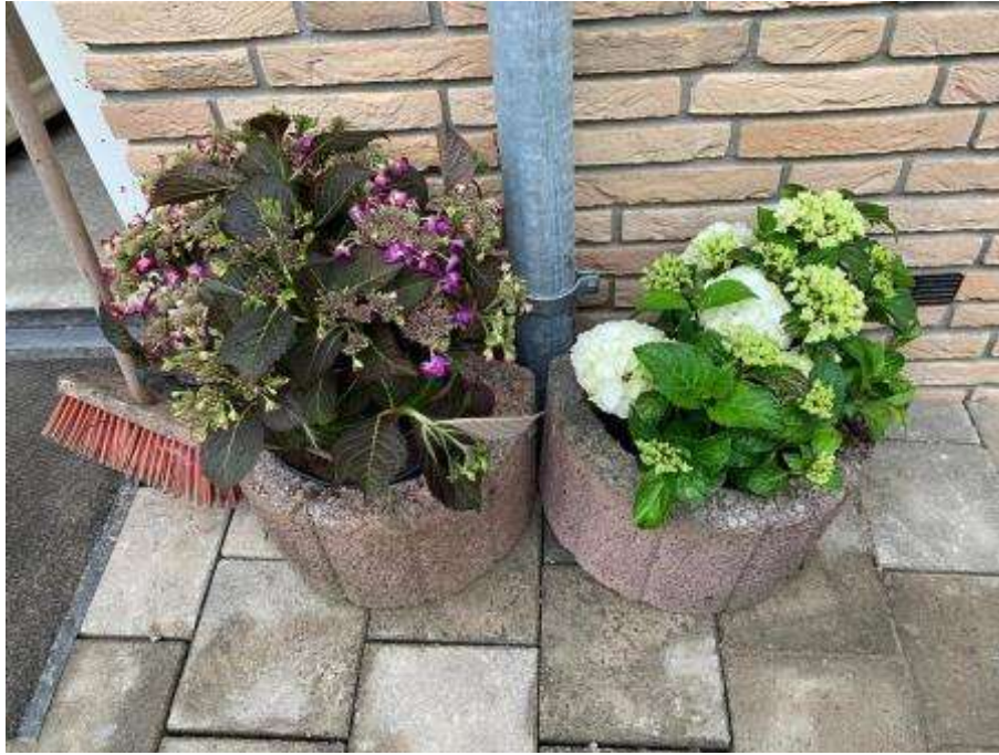
3 - Bewoners aan de Gronoviusstraat hebben na de renovatie van hun woningen samen geveltuintjes aangelegd. Een extra verfraaiing van hun buurt. De bakken hebben ze zelf aangeschaft, voor de beplanting hebben ze geld ontvangen van WijDeventer.