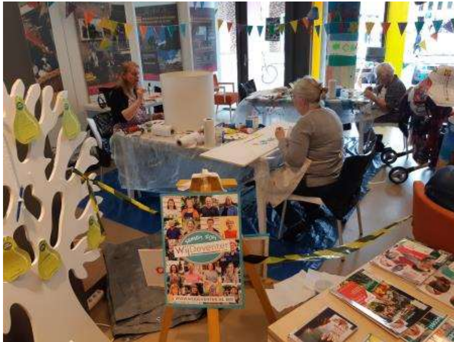
13 - Tijdens de themadag Kenjebuurt doen bezoekers mee met het project 'Lichtje in de wijk', door een lampenkap te beschilderen.