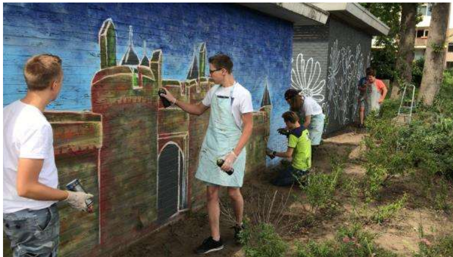
16 - In het Oostrik aan de Doornenburg hebben jongeren twee elektriciteitshuisjes voorzien van prachtige graffiti die door de buurt zelf is ontworpen. Eerder hadden volwassenen al het groen in deze omgeving opgeknapt.