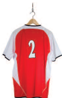
De sportvereniging verbindt