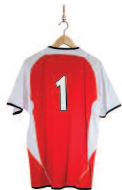
De sportvereniging professionaliseert