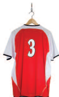
Beter benutten van de sportinfrastructuur

Vanuit het gemeentelijk beleid worden sportverenigingen gestimuleerd om zich in te zetten in het sociale domein. Daarvoor is het nodig dat sportverenigingen gemotiveerd worden om een rol in dit domein te willen spelen. De corebusiness van de sportvereniging ligt op het gebied van de wedstrijdsport waarmee zij mensen en vooral kinderen en jongeren aanzetten tot het leveren van prestaties op ieders niveau en daarmee een belangrijke rol vervullen als het gaat om het versterken van hun weerbaarheid. In de laatste jaren zijn sportverenigingen zich ook gaan bezighouden met activiteiten en projecten die 'sport als middel'