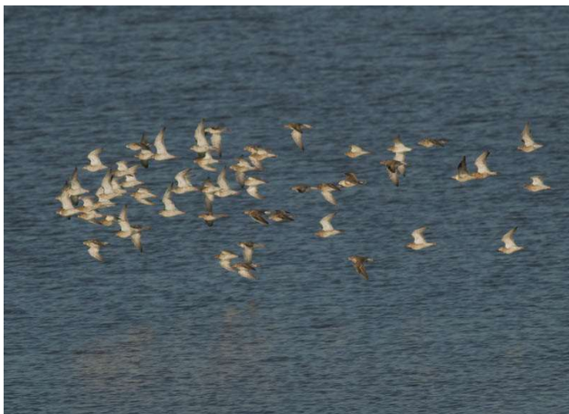
Grote groep Kemphanen, door Michiel Wesselink