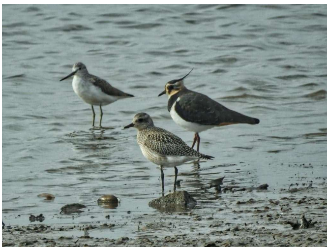
Groenpootruiter, Kievit en Zilverplevier door Ben Sanders.