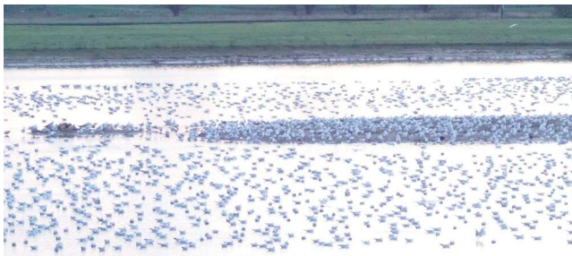
Duizenden meeuwen aan het overwinteren, samen met meer dan honderd wulpen.