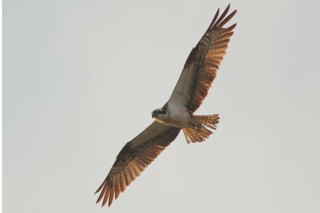
Jagende Visarend door Michiel Wesselink