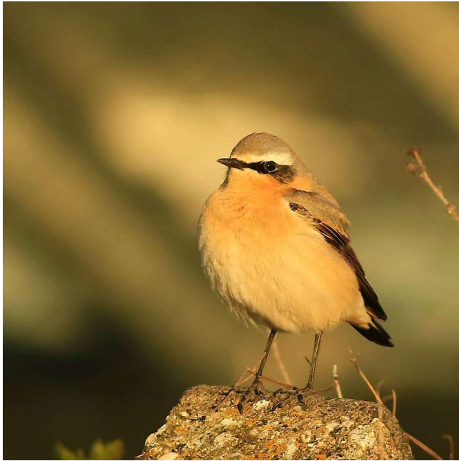
Tapuit door Michiel Wesselink