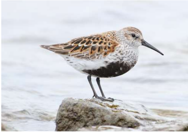
Bonte strandloper door Leon Walraven