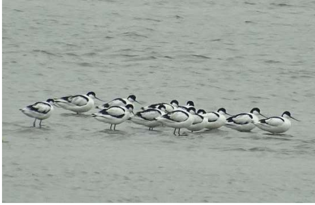
Grote groep Kluten, door Ben van Dorth