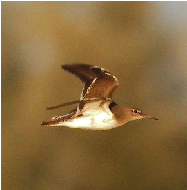
Oeverloper die broed bij de Veenoordkolk door Michiel Wesselink