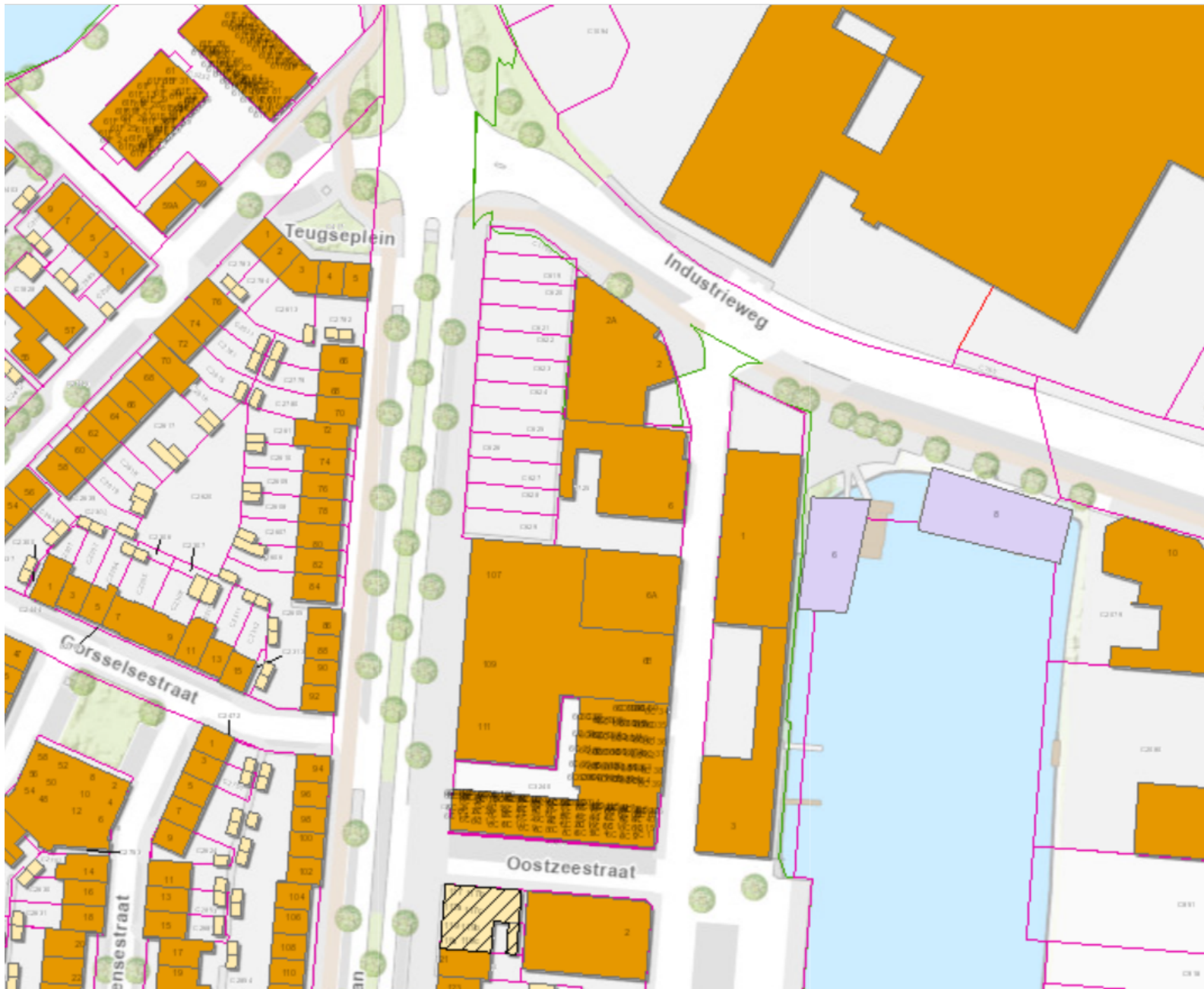
Bijlage 1: Bestaande situatie Havenkwartier