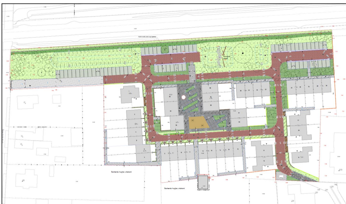
Afbeelding 2 Impressie gewenste invulling

Er zal in het plangebied daarnaast ruimte worden gerealiseerd voor de benodigde parkeervoorzieningen, groenvoorzieningen en waterberging. Dit is met name voorzien ter plaatse van gronden tussen de spoorlijn en de woonbuurt. In de volgende afbeeldingen is een indicatieve inrichtingstekening opgenomen