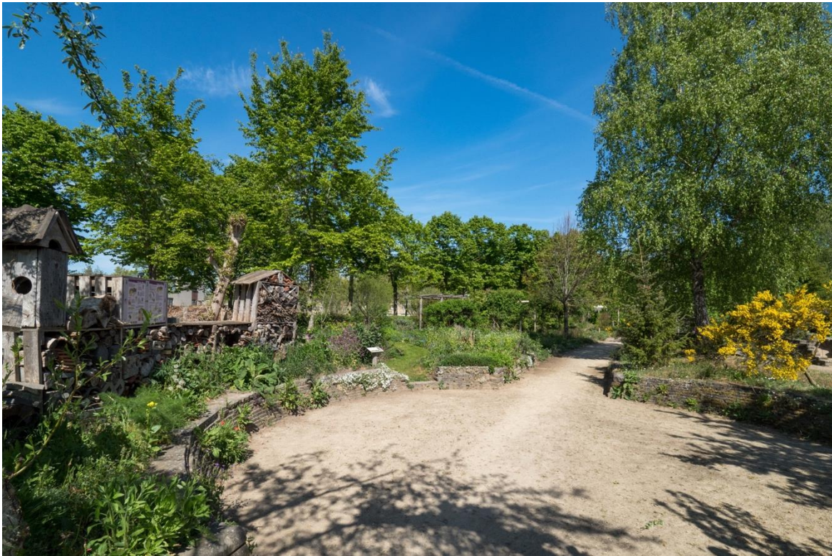
Biodiversiteit bij de Ulebelt