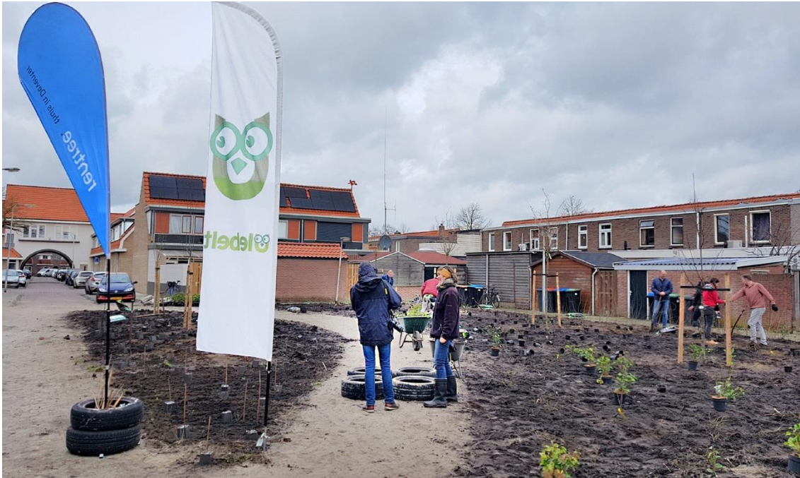
Aanleg Zandweerd buurttuin met bewoners. Ulebelt project in opdracht van woningbouwcorporatie Rentree