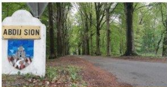
Kloosterboerderij en brouwerij Nieuw Sion