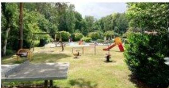
Zwembad De Looërmark

De voormalige abdij Sion had 150 jaar lang een florerend boerenbedrijf. Nieuw Sion wil de oude boerderijfunctie op een eigentijdse manier herstellen, door te investeren in een grote groentetuin met kas en een ambachtelijke kloosterboerderijbrouwerij. Met de investering in een kleinschalige ambachtelijke bierbrouwerij wil Nieuw Sion kloosterbieren brouwen, waarvan de grondstoffen op eigen land of door akkerbouwers in de directe omgeving van het klooster worden verbouwd. Het restproduct dat voortkomt uit het brouwproces gaat als veevoer naar omliggende melkveehouders (kringlooplandbouw).