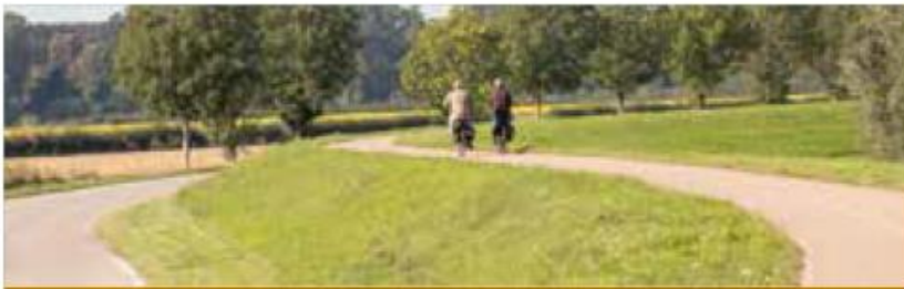
De Slinger van Salland