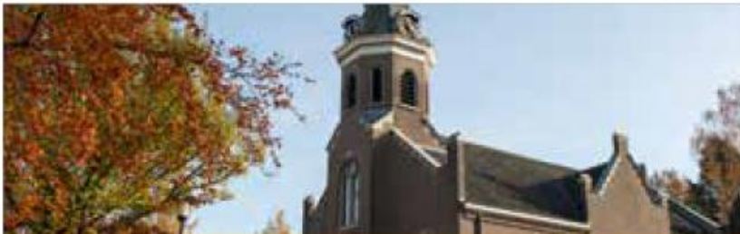
Van schoolplein naar buurtplein Okkenbroek

MKB Deventer heeft met StageinregioSalland.nl een online stageportal opgezet waarop bedrijven zich kunnen presenteren naar de Sallandse studenten en andersom. Door hen van jongs af aan te verbinden met het regionale bedrijfsleven voorkomt Salland dat jong talent buiten Salland gaat werken.