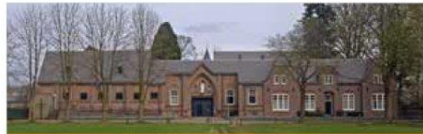
Gastenhuis Nieuw Sion

Loo heeft een nieuw, duurzaam buurthuis gerealiseerd dat geschikt is voor rolstoelgebruikers. Loo heeft het pand met vrijwilligers gebouwd en heeft het zelf in eigendom en beheer. De bouw en de activiteiten bevorderen de betrokkenheid en samenhang in de gemeenschap. Met het nieuwe buurthuis kan Loo bestaande en nieuwe activiteiten organiseren voor een bredere doelgroep.