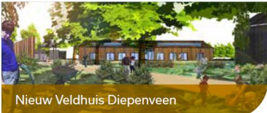
Nieuw Veldhuis Diepenveen