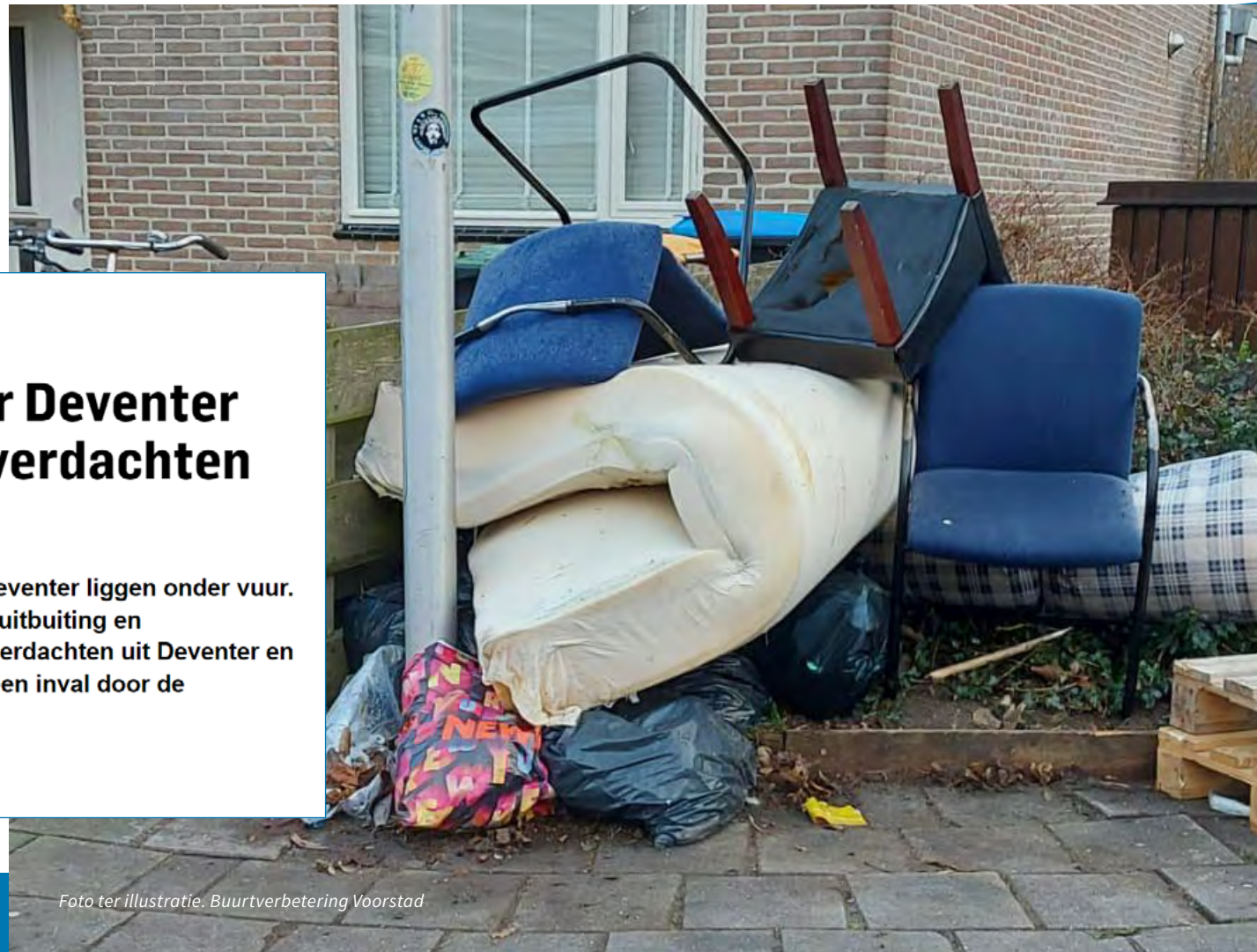
Foto ter illustratie. Buurtverbetering Voorstad

overbewoning wat vaak resulteert in geluidsoverlast in de nachtelijke uren, door bijvoorbeeld het af- en aanrijden van busjes door wisseldiensten. Ook beschikken de bewoners van niet-zelfstandige woonruimtes vaak niet over een afvalpas waardoor er afvalproblematiek ontstaat.