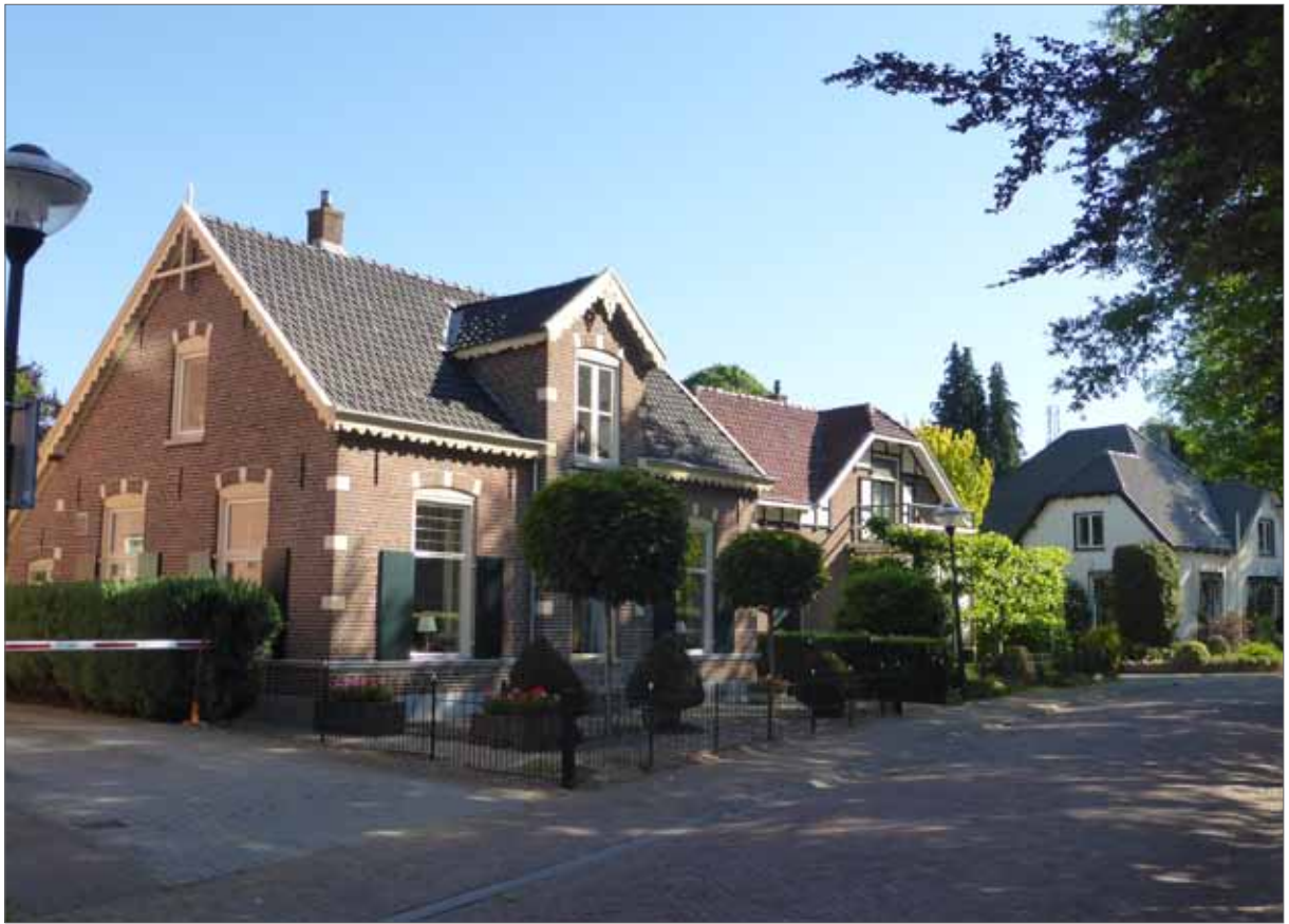
beeld Dorpsstraat Bathmen