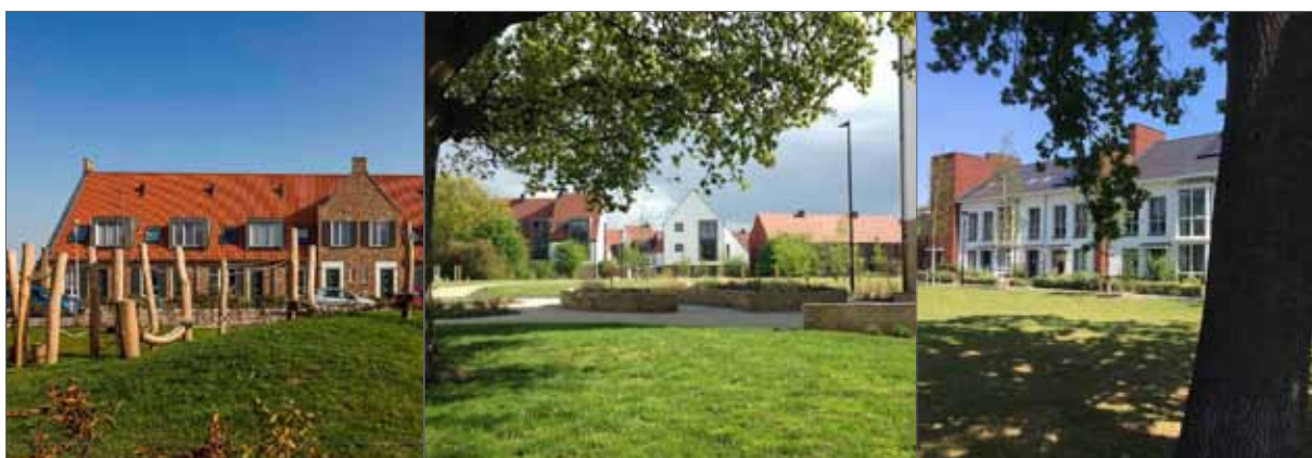
beeld inrichting brink

Op de Brink wordt een speelplek aangelegd die geschikt is voor de leeftijdscategorie 0-6 en 6-12 jaar. Naast het toepassen van speeltoestellen kan ook gekozen worden voor het toepassen van spelaanleidingen. Voor de speelplek worden natuurlijke materialen en kleuren gebruikt waarbij de waterberging onderdeel kan uitmaken van het spelen. Spelaanleidingen