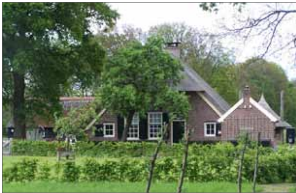
landschappelijk, informele overgang randen erf