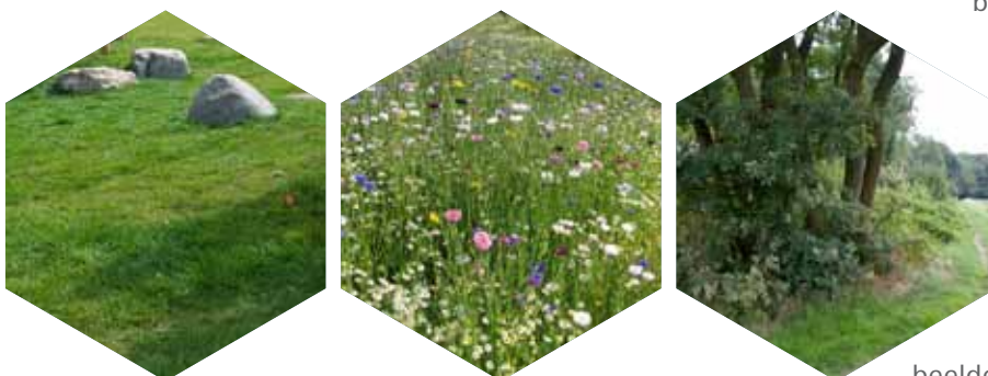
beelden inrichting groene rand