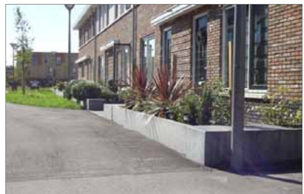
integreren zitelement of opnemen stoepenzone rond Brink