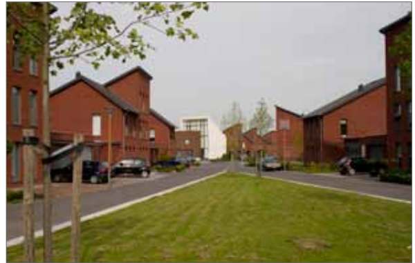
beeld special als herkenningspunt in buurt