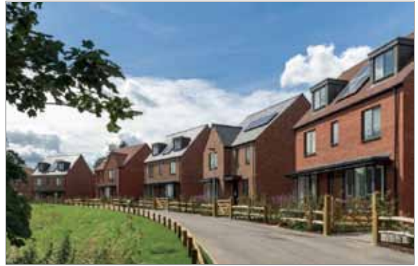
bouvvolumes twee lagen met kap