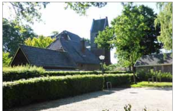
beeld bebouwing Bathmen