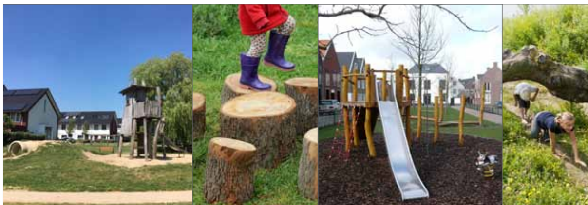
beeld natuurlijke inrichting speelplek

In het inrichtingsplan worden bovenstaande punten nader uitgewerkt.