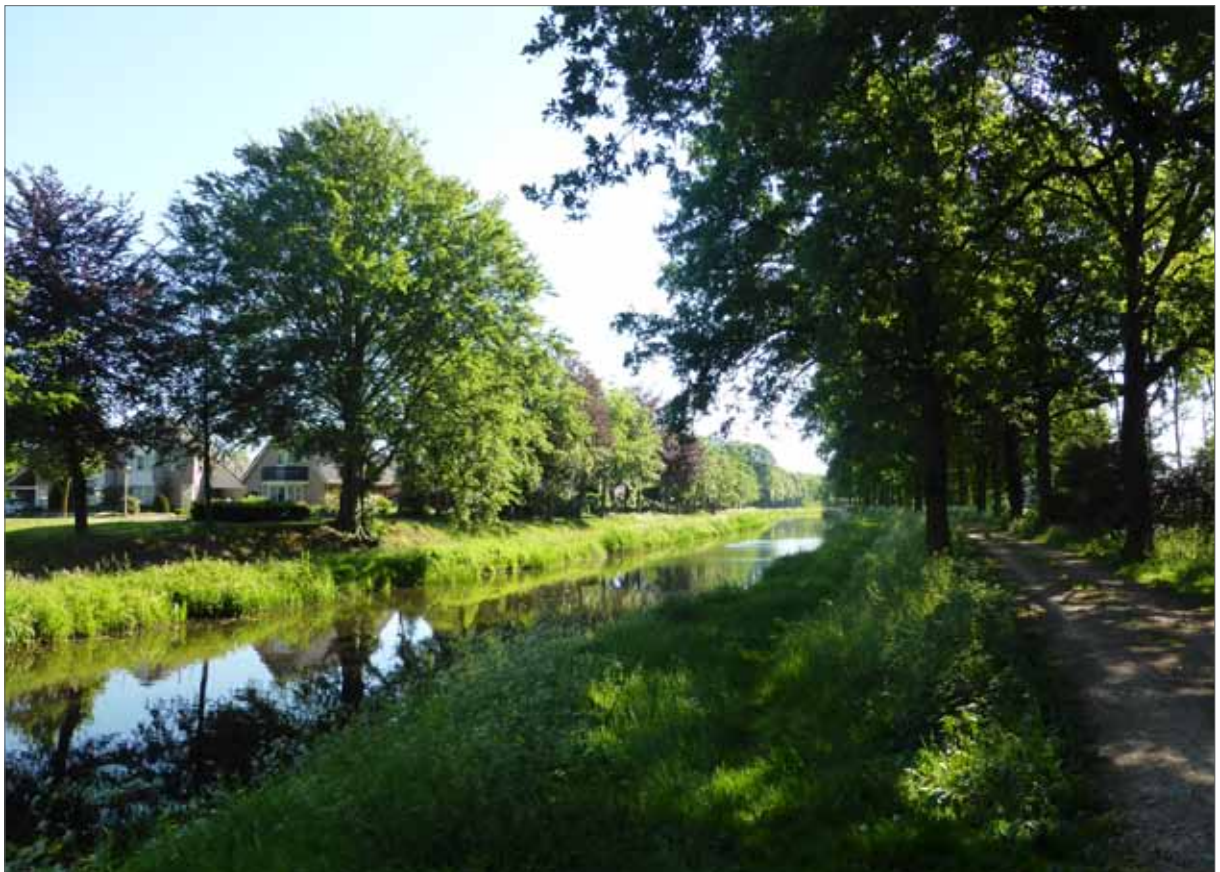
beeld Schipbeek Bathmen