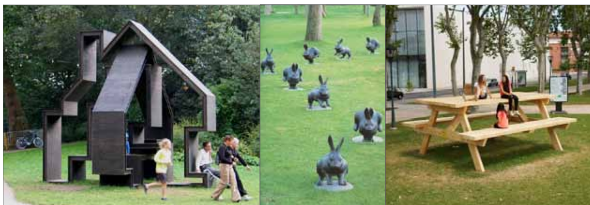
beeld kunsttoepassing in de openbare ruimte