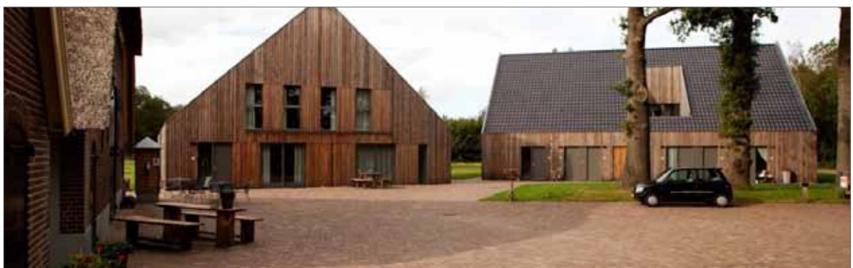
directe relatie gebouwen - erfruimte