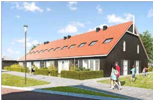
schuurarchitectuur met rug aan rugtype