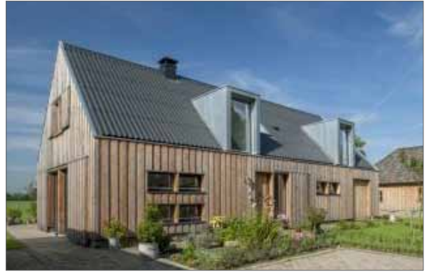
helder bouwvolume van één laag met kap