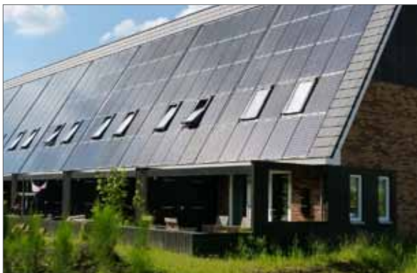
erfscheiding als onderdeel van bouwvolume