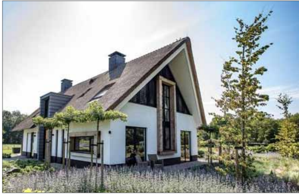
mogelijk beeld pronkwoning