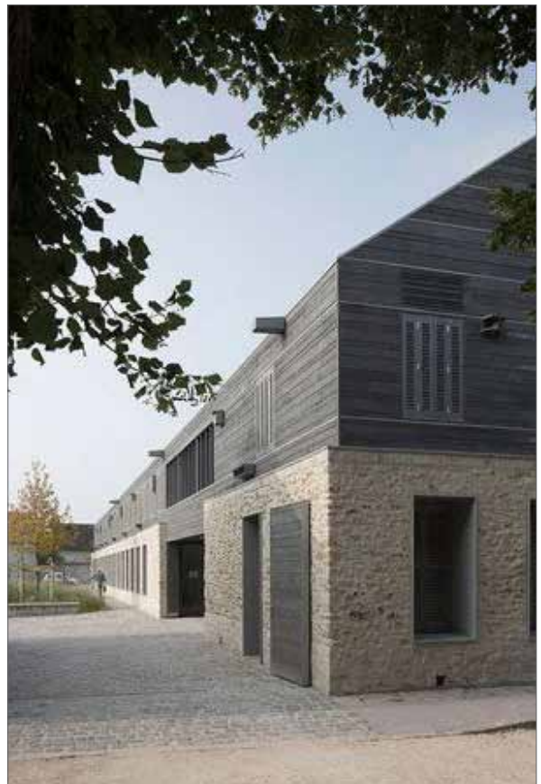
eigentijdse vertaling architectuur boerenerf