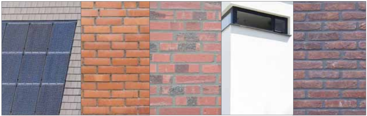
kleuren en materiaal dorpse buurt