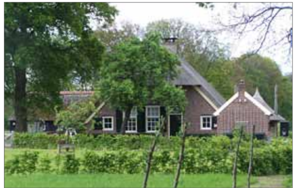
beeld bebouwing erven rond Bathmen