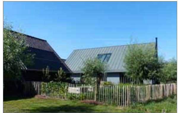
schapenhek rond gemeenschappelijke tuin