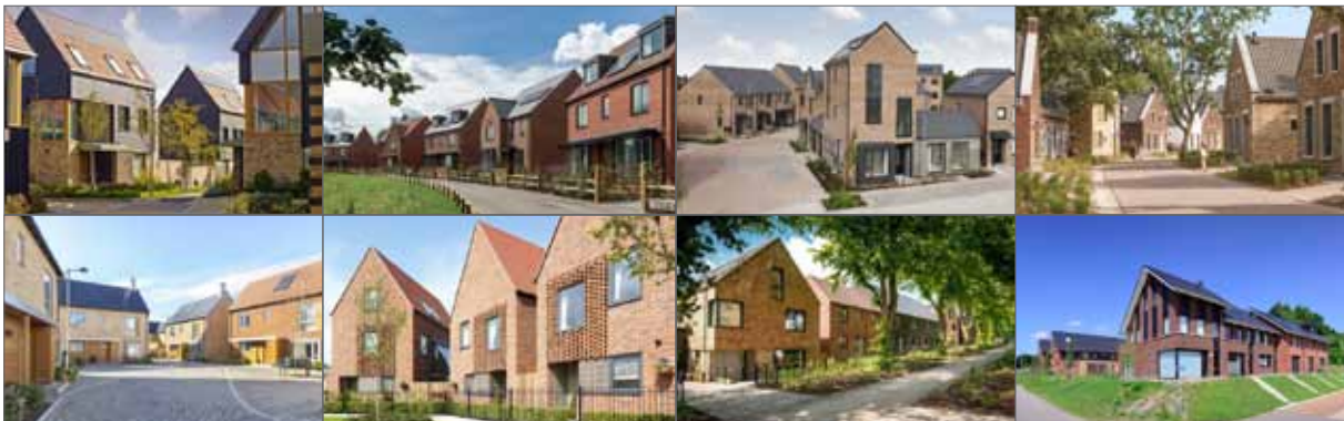
beeld samenhang bebouwing dorpse buurt