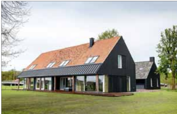
helder bouwvolume van één laag met kap