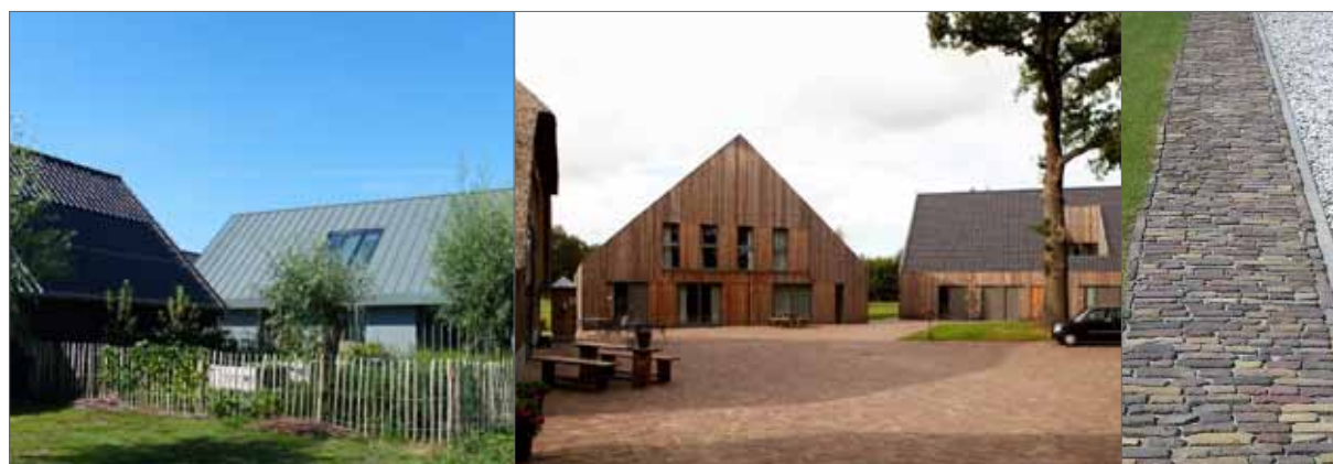
beeld inrichting erf