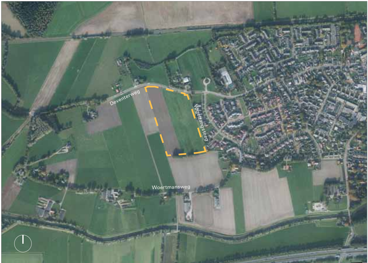
luchtfoto Bathmen met locatie Bathmense Enk 3