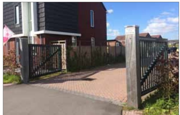
entree erf duidelijk vormgeven