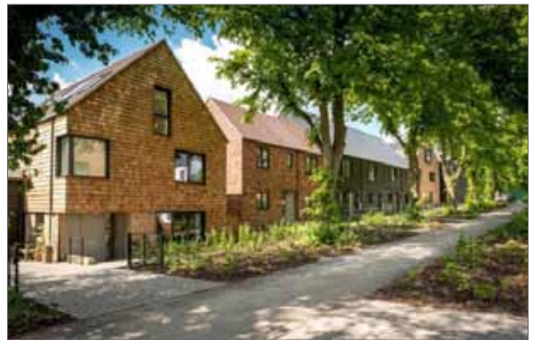
beeld samenhang in architectuur