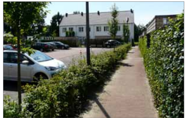
hoge groene erfscheiding rond parkeerkoffers en waar zij- en achtertuinen grenzen aan openbaar gebied