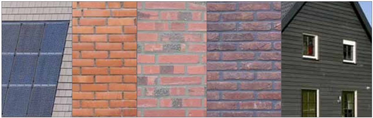
kleuren en materiaal erfbebouwing