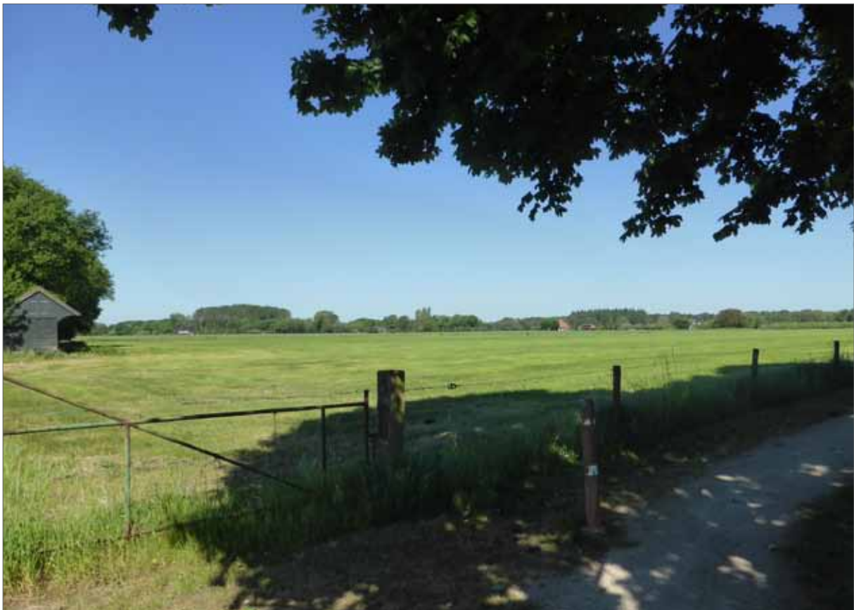
locatie Bathmense Enk 3 Bathmen

In voorliggend document wordt eerst een beeld geschetst van Bathmen en op welke wijze het bestaande dorp een inspiratie is geweest voor het beeldkwaliteitplan. Vervolgens worden de toetsingscriteria voor de bouwplanontwikkeling beschreven. Deze zijn opgedeeld in criteria voor de erven en criteria voor de woonbuurt. Tot slot wordt de beeldkwaliteit voor de openbare ruimte beschreven die in het stedenbouwkundig plan en inrichtingsplan verder wordt uitgewerkt.