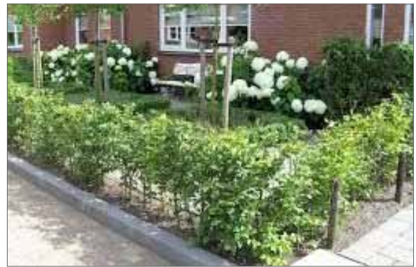
groene lage erfscheiding