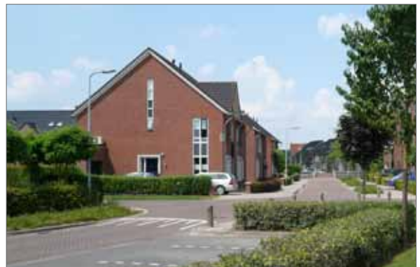
aandacht voor entree en kopgevel bouwblok