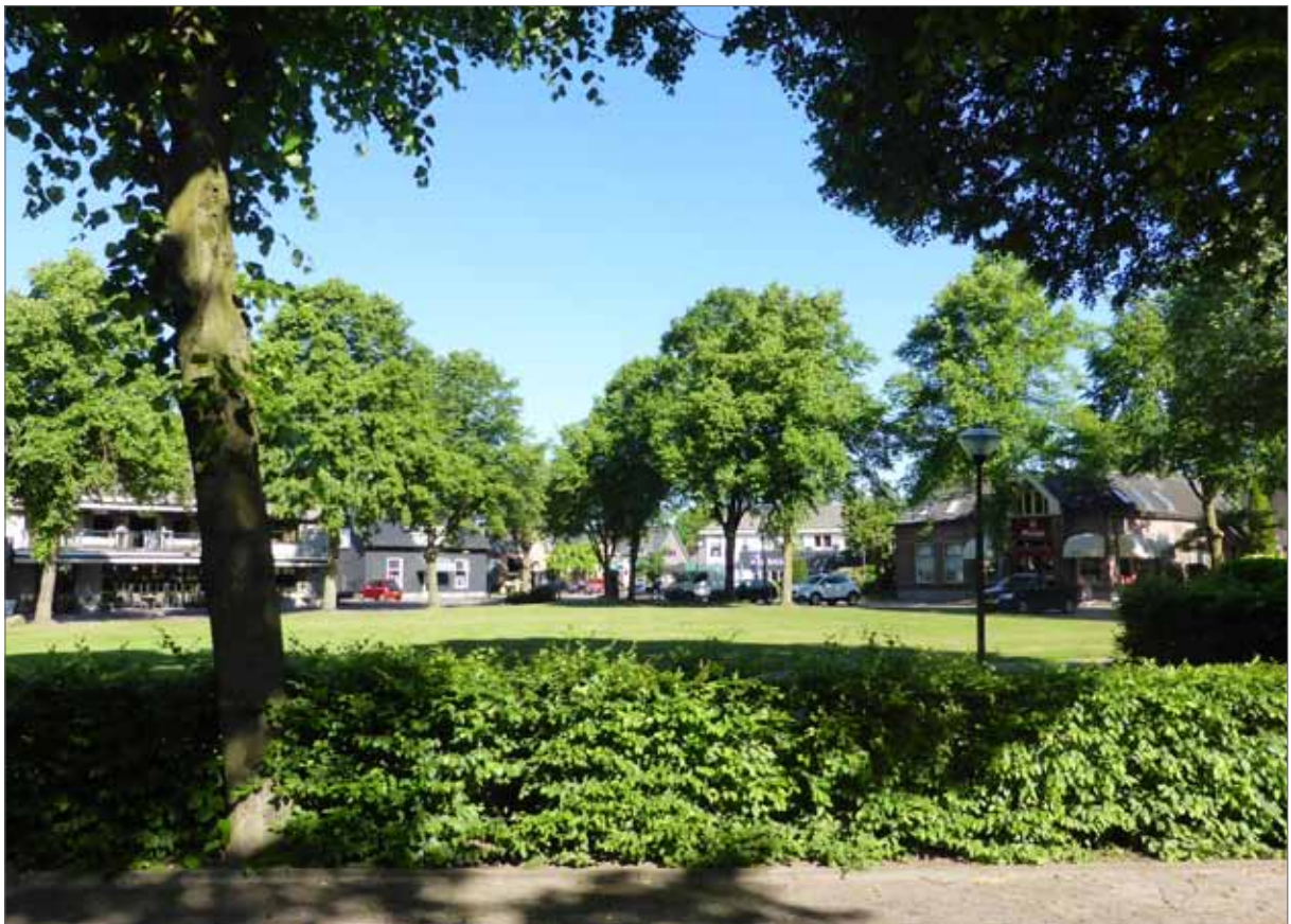
beeld Brink Bathmen