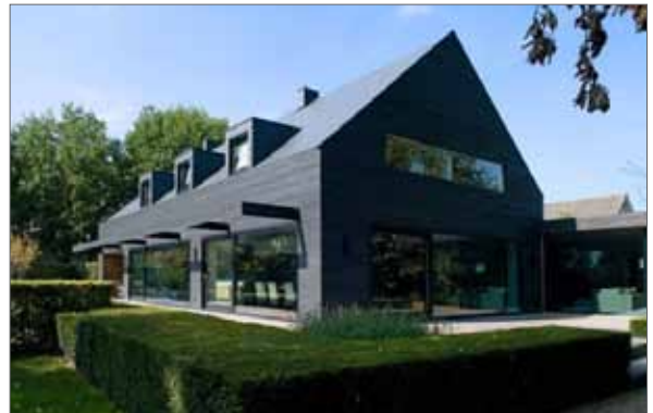
schuren als basis voor overige bouwvolumes