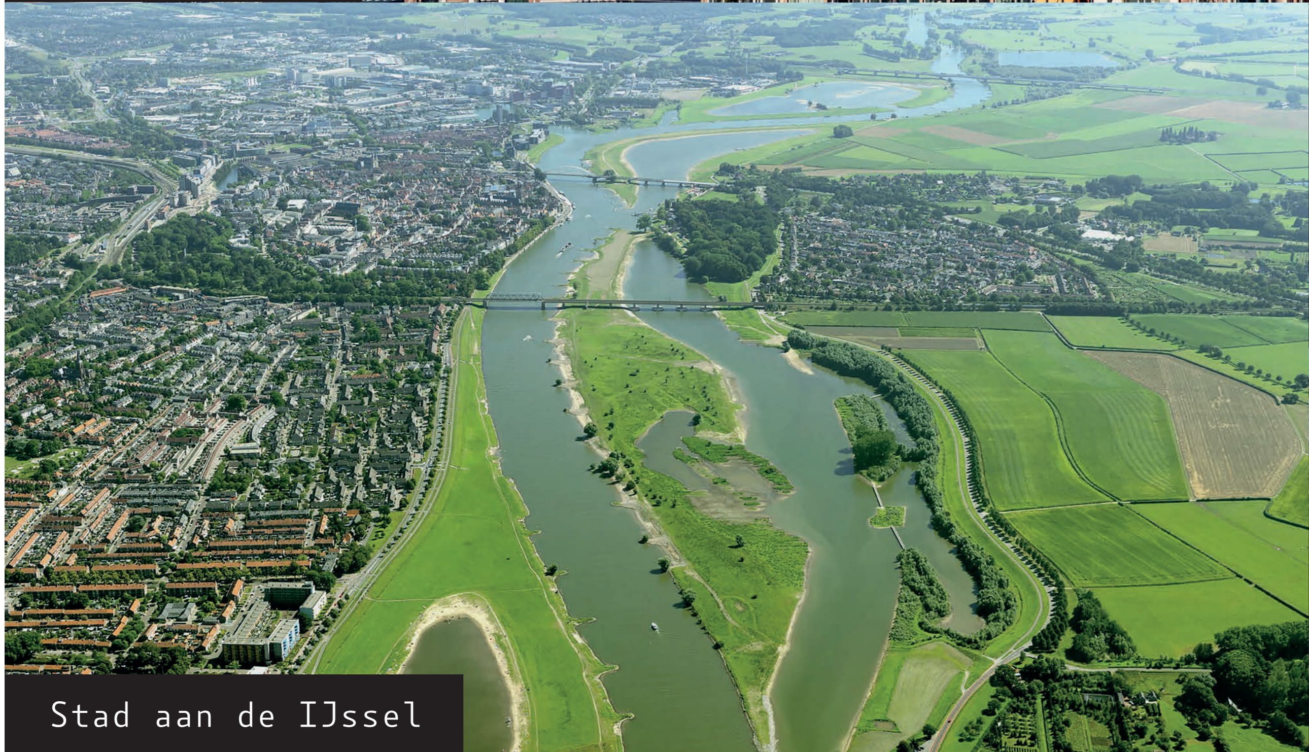
Stad aan de IJssel