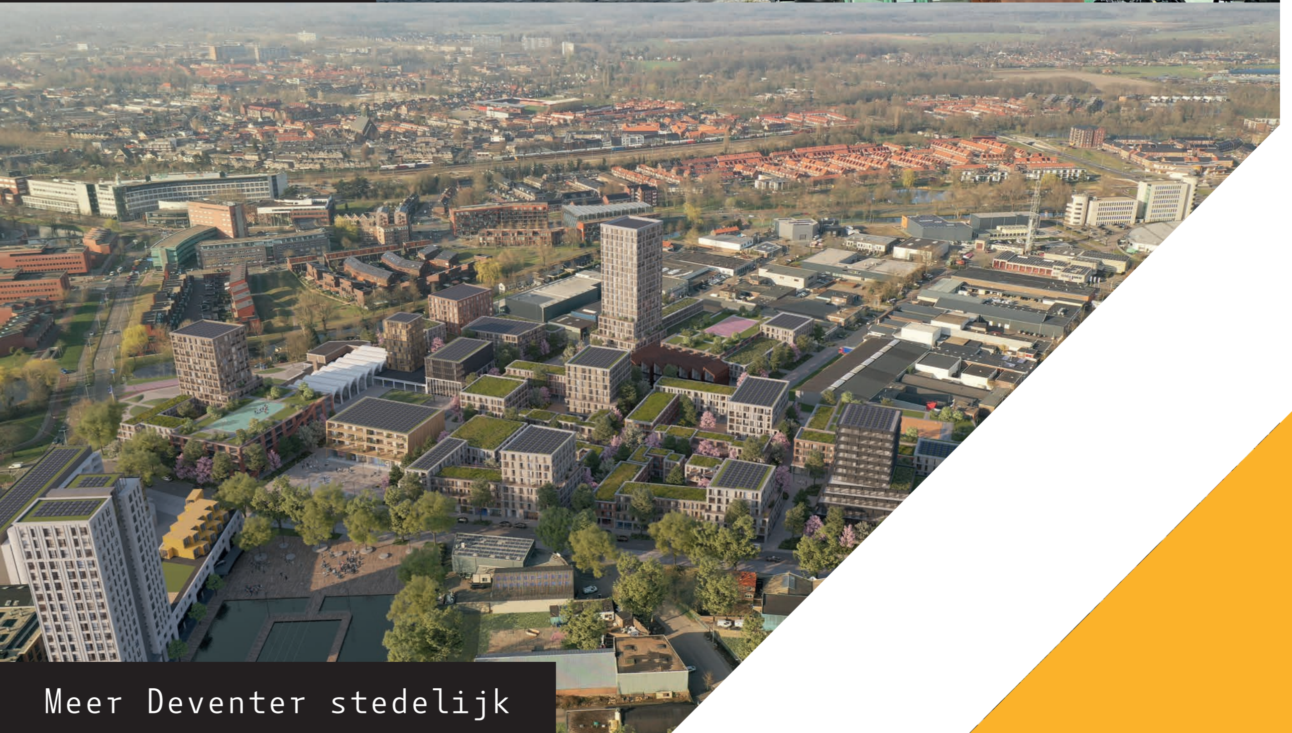
Meer Deventer stedelijk