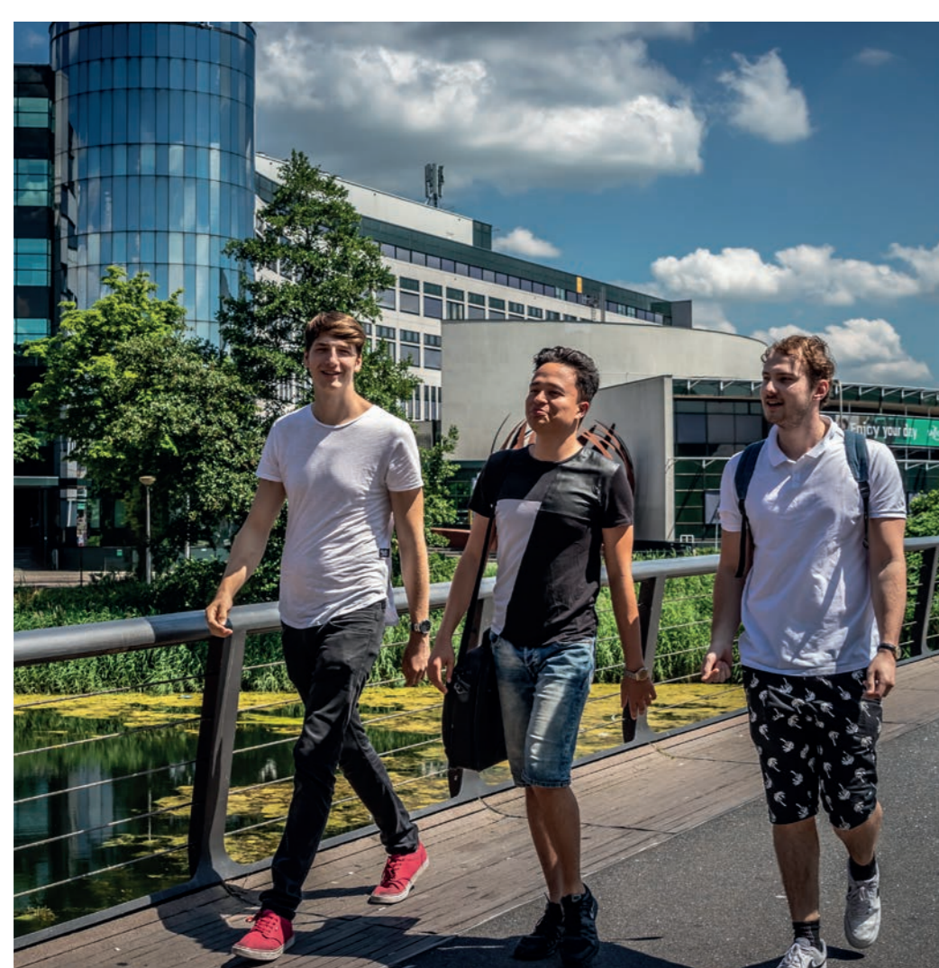
We bouwen voor talent van buitenaf

Het mengen van verschillende doelgroepen in woongebieden is belangrijk.