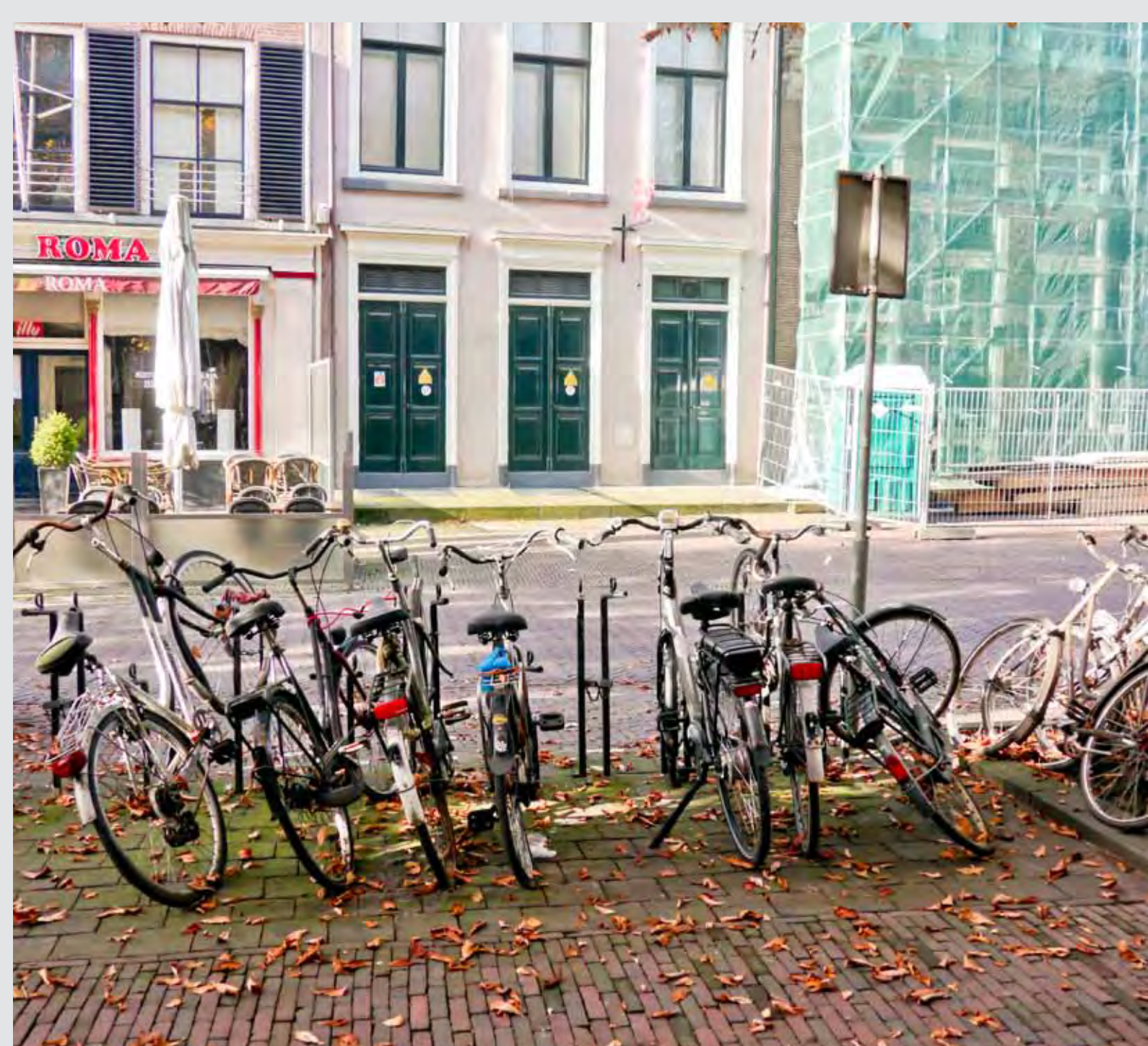
Fietswrakken in de openbare ruimte