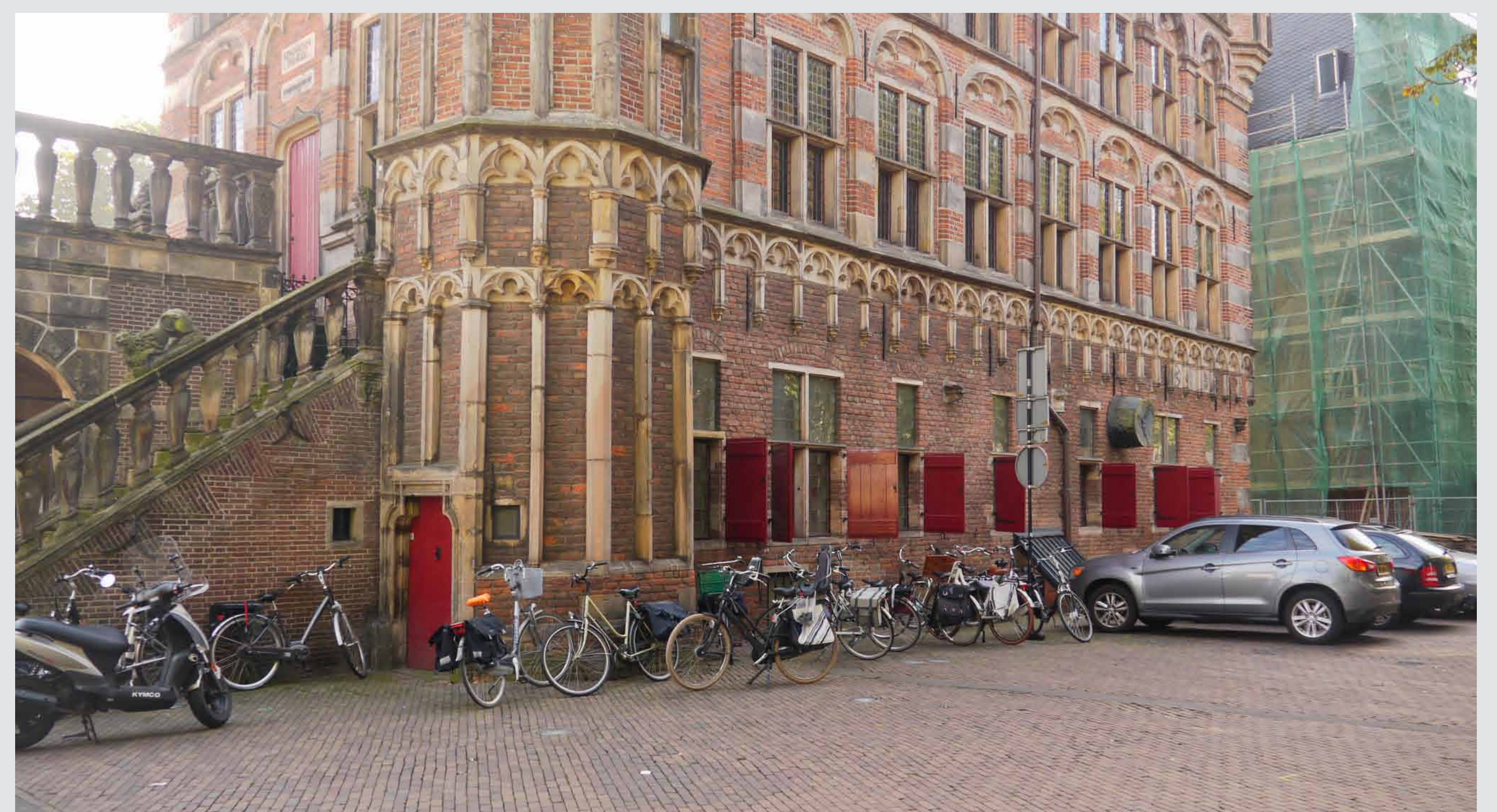
Aantasting straatbeeld en beleving monumenten