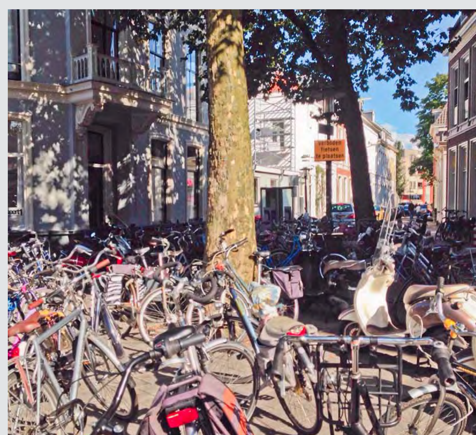
Inefficiënt gebruik openbare ruimte