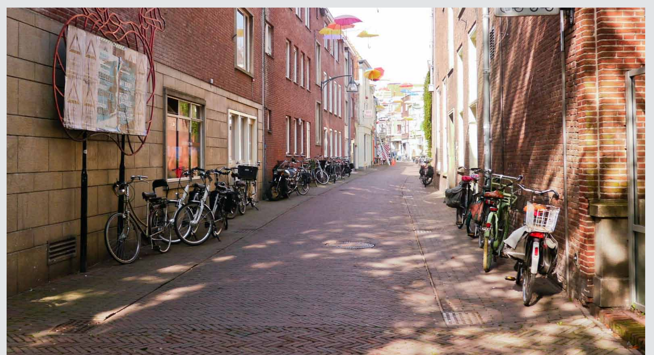
Afwenteling bewonersparkeren op openbare ruimte