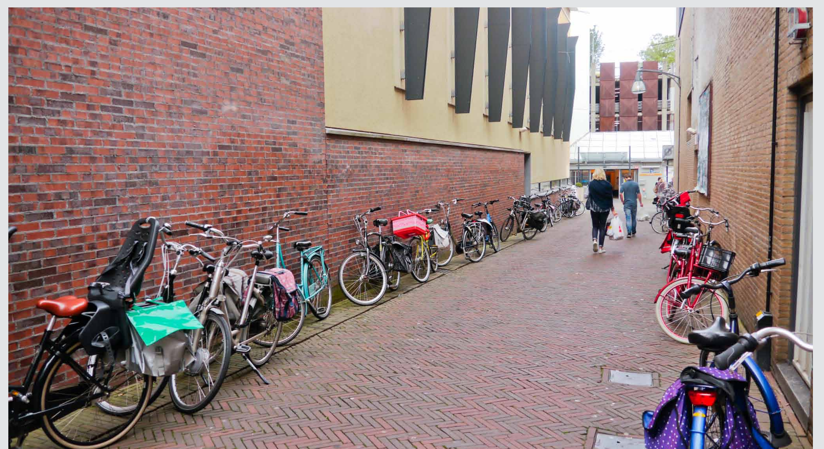
Knelpunt voor hulpdiensten

A Stadhuiskwartier B Nieuwmarkt C Stromarkt D Zandpoort E Broedersplein F Keizerstraat G Het Boreel H Nieuwstraat I Smidsgang J Bergkerk