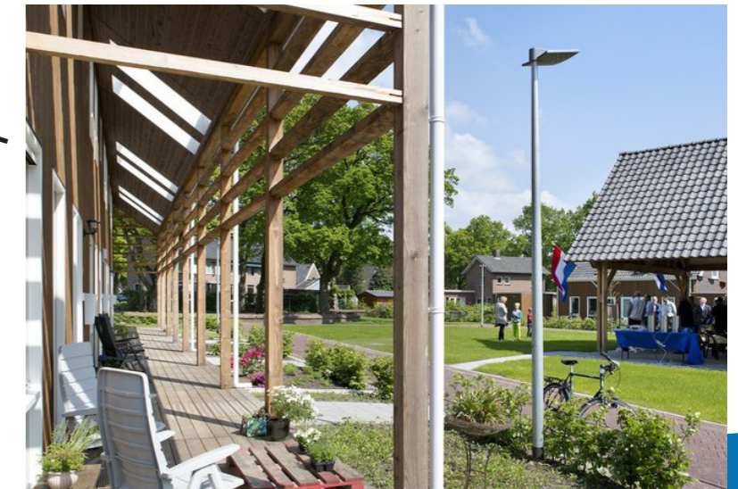
Nei Arf, Exloo_DAAD architecten