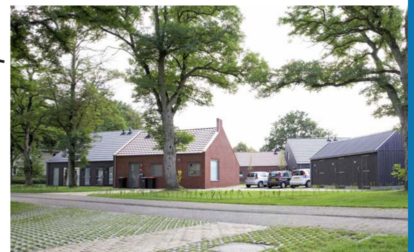
Brinkwoningen Schoonoord AAS