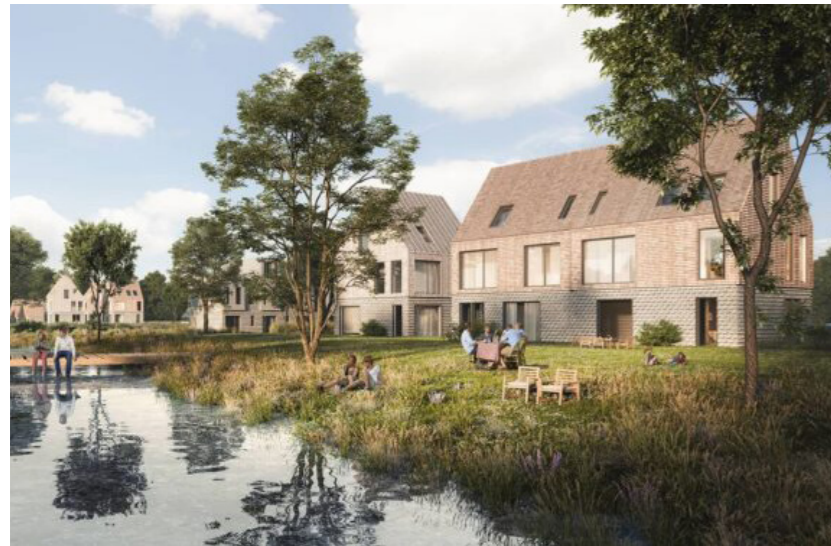
Housing near Kelleris Hegn SWECO