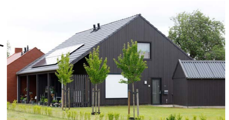
Brinkwoningen Schoonoord AAS